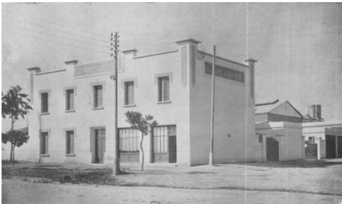
Vue de la succursale de l'Air Liquide, route des Ouled-Ziane, à Casablanca

Direction pour l'Afrique du Nord — 1, rue de Lyon, Alger Agences et usines — Alger, Oran, Bône, Casablanca, Tunis, Sfax