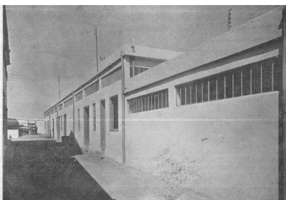
Ateliers et bureaux de l'usine de Casablanca.