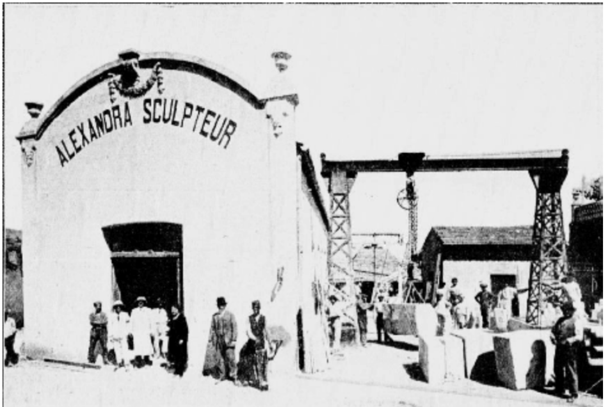
Une des façade