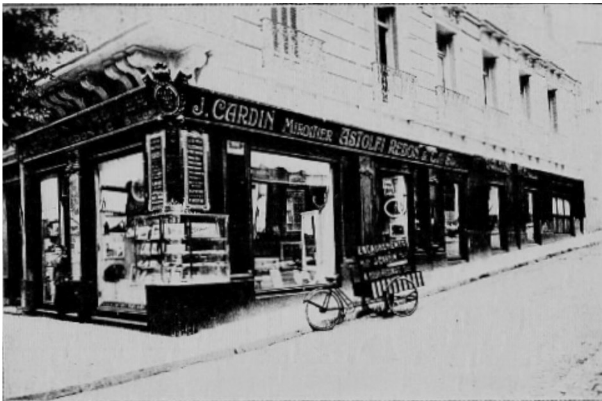
Les Établissements Astolfi, Redon et Cie d'Alger.

ASTOLFI, REDON & Cie, SUCCESSEURS ( L'Afrique du Nord illustrée , 4 juin 1921)