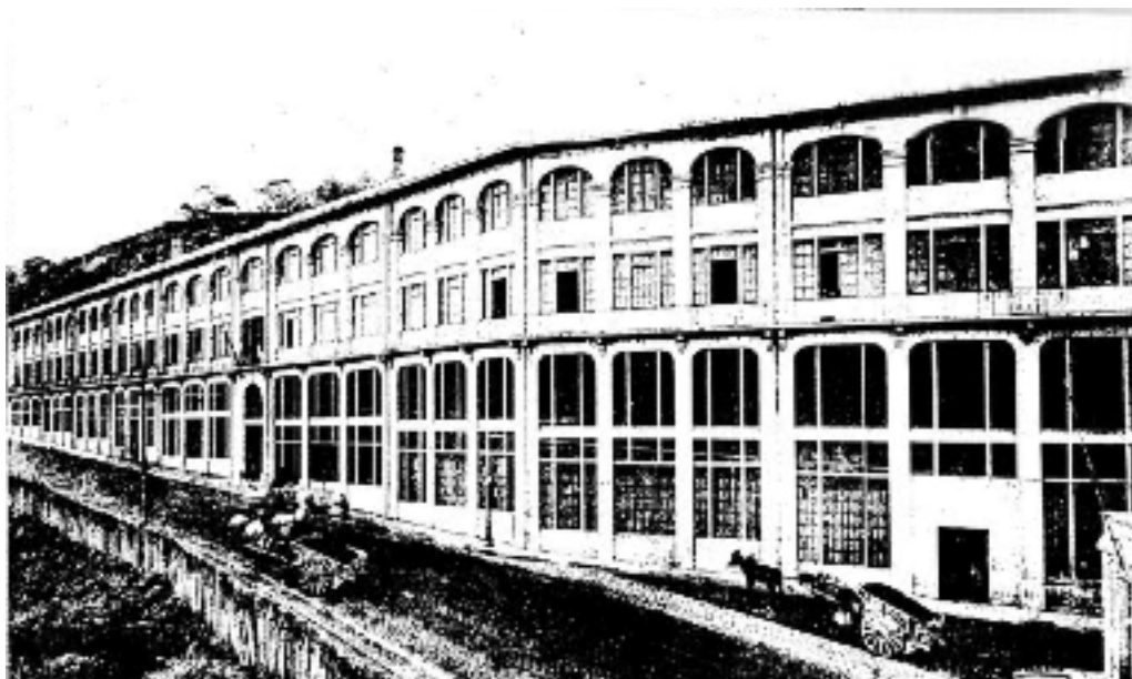
La façade nord des Établissements Bastos.