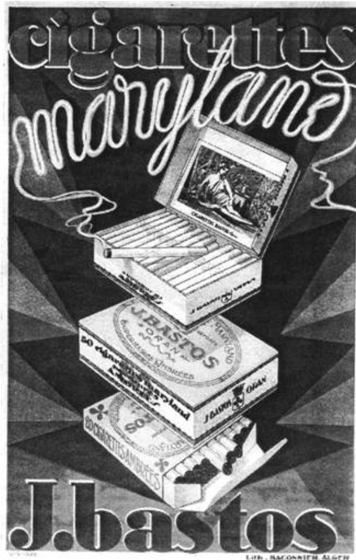
Cigarettes Marylane J. Bastos Lith. Baconnier, Alger

TABACS, CIGARES ET CIGARETTES BASTOS ( Le Mercure africain , 10 octobre 1929)