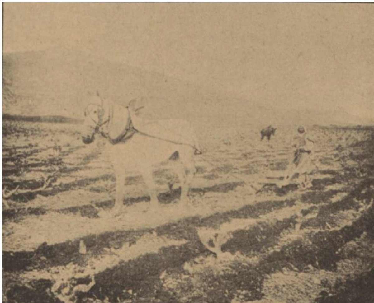
À POTINVILLE. LES LABOURS.

La laine et les tissus de laine en Tunisie par M. Lucien Sacy