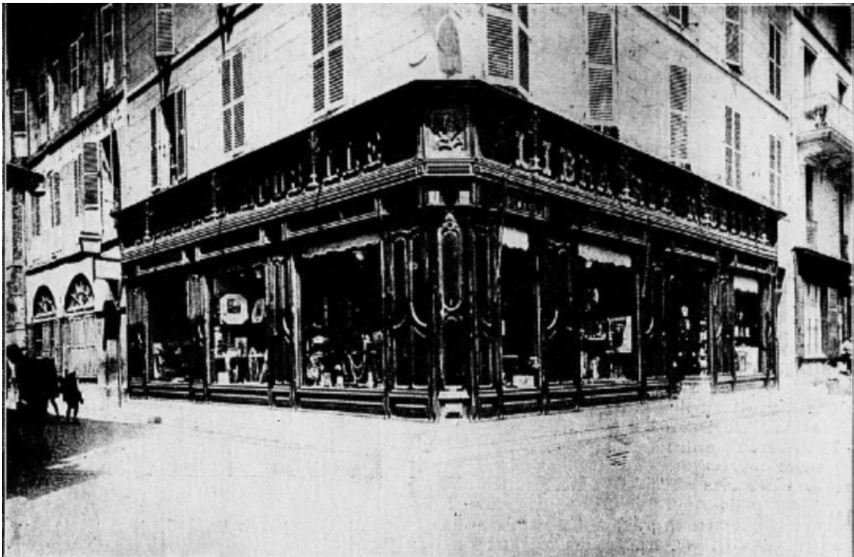
Vie générale de la librairie Roubille, Chapelle successeurs

CONSTANTINE La maison Roubille ( L'Afrique du Nord illustrée , 31 décembre 1927)