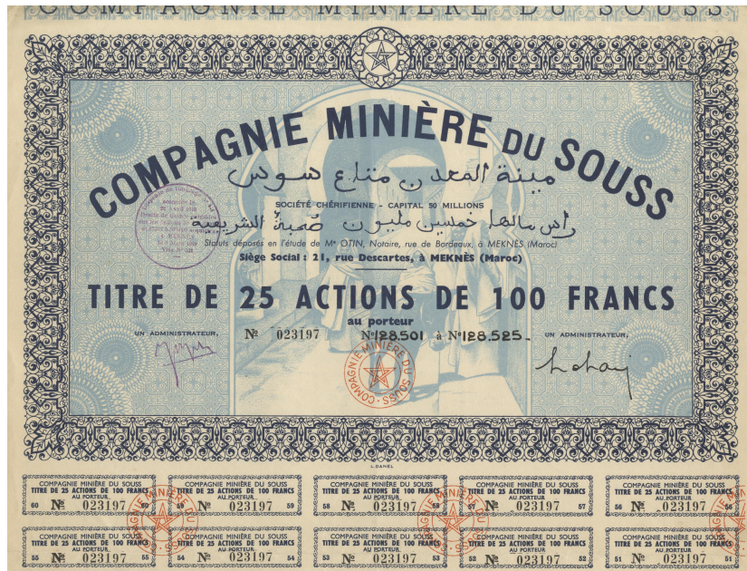
Idem TITRE DE 25 ACTIONS DE 100 FRANCS