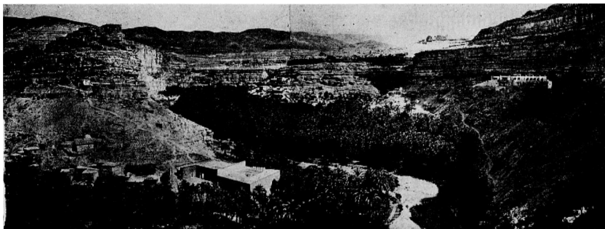
Panorama des cañons de Rouffi. A droite, à flanc de montagne : l'Hôtel transatlantique

Le domaine touristique algérien, déjà si riche en beautés, diverses vient d'étendre encore ses limites.