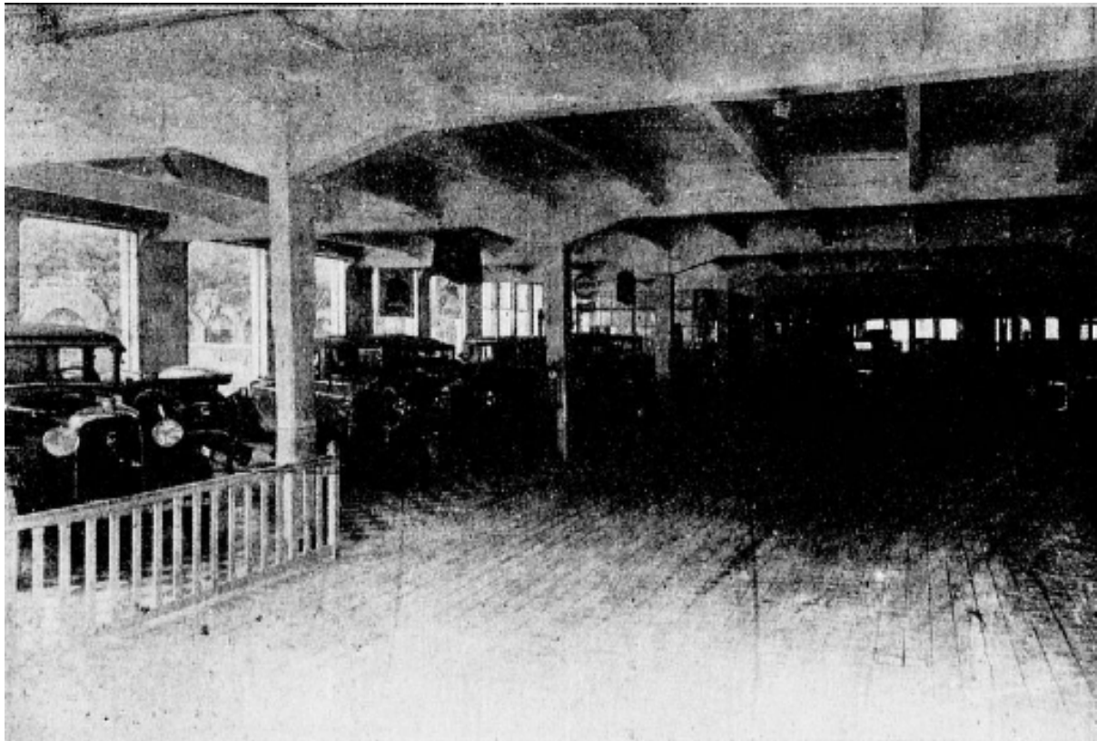
Vue intérieure du garage

Au sous-sol, également accessible de plain-pied de la rue du 11-Novembre, se trouve l'atelier un peu moins vaste mais aussi bien installé que le garage ; vingt à vingt-cinq voitures y peuvent être aisément en chantier à la fois.