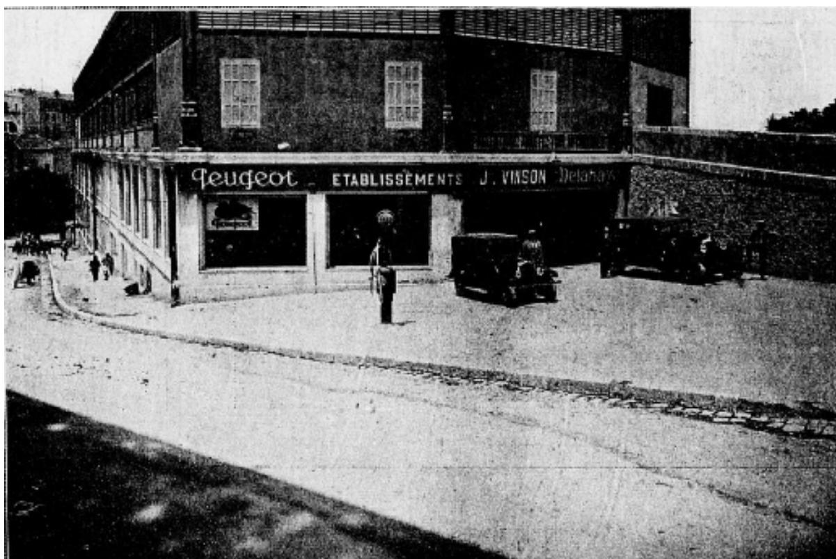
Vue extérieure des Éts Vinson à Constantine

Le commerce de l'automobile prend, dans le département de Constantine, le plus grand et le plus peuplé de la colonie, une extension considérable, due, certes, en grande partie, aux besoins de plus en plus nombreux et impérieux que l'on a à satisfaire, mais aussi aux initiatives intelligemment audacieuses d'hommes d'affaires clairvoyants et d'une compétence éprouvée, comme ceux à l'œuvre de qui nous sommes heureux de pouvoir consacrer dans ce numéro, les quelques lignes qui vont suivre.