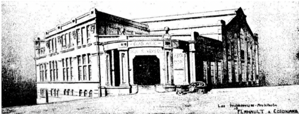
Vue du garage Vinson d'Oran

Devenus eux-mêmes trop étroits, les ateliers d'Alger sont sur le point de s'agrandir et de se développer à leur tour, et c'est à leur intention que l'on procède à de nouvelles constructions rue Charras et rue Jean-Rameau.