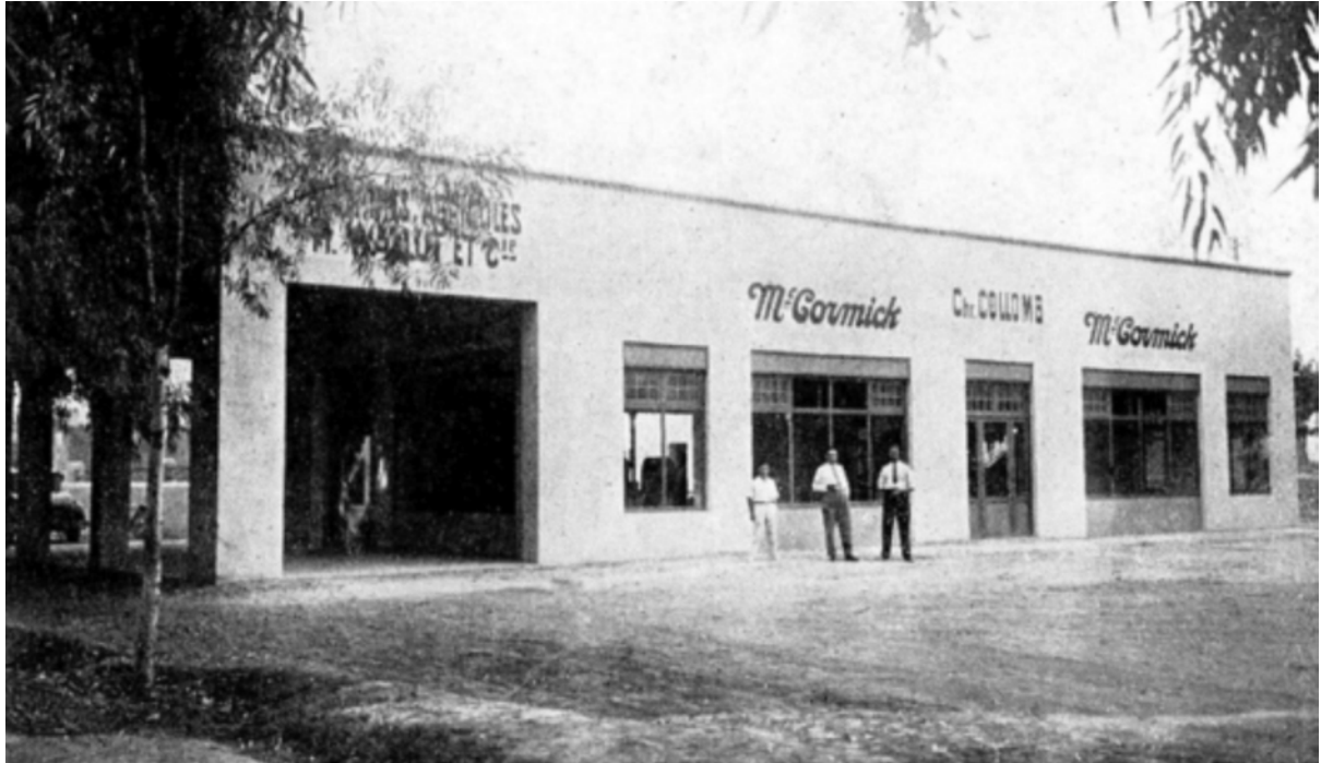
Agence de Marrakech : Ch. Collomb