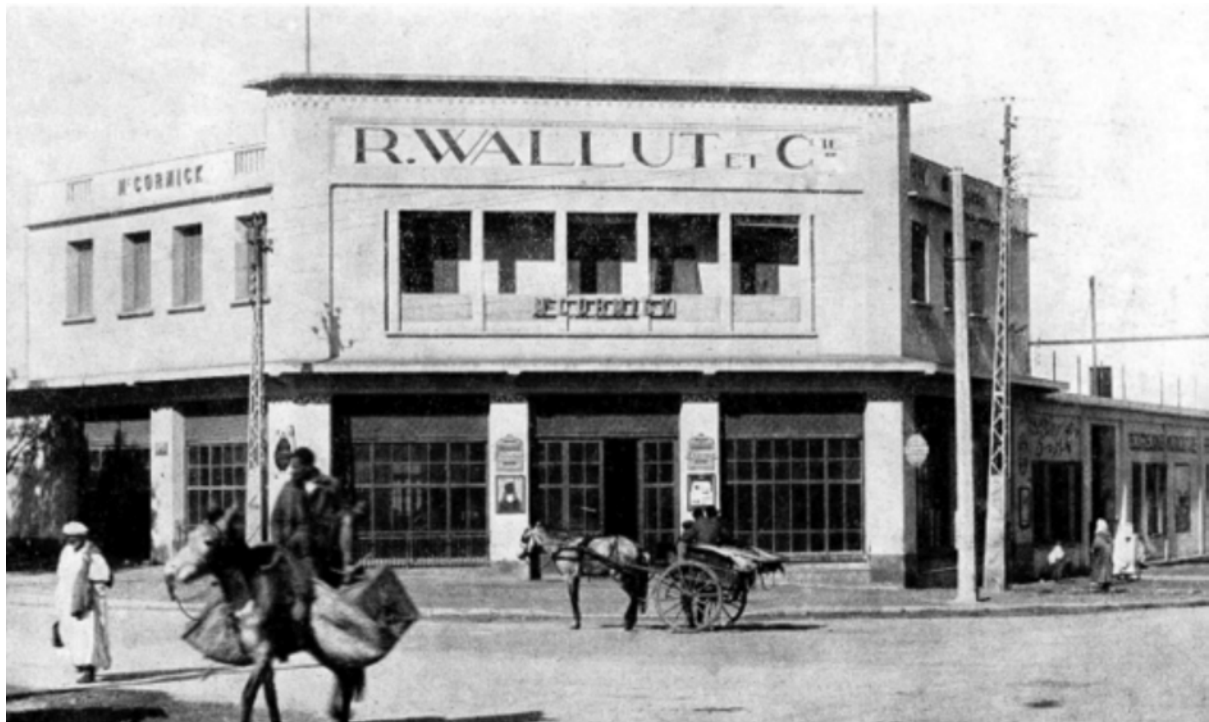
Succursale de Casablanca

L'effort que la Société anonyme « MACHINES AGRICOLES R. WALLUT ET Cie » a fait au Maroc, depuis les premières heures du Protectorat, est trop important pour qu'il ne soit pas cité comme un exemple de la confiance que les esprits clairvoyants accordent au Maroc