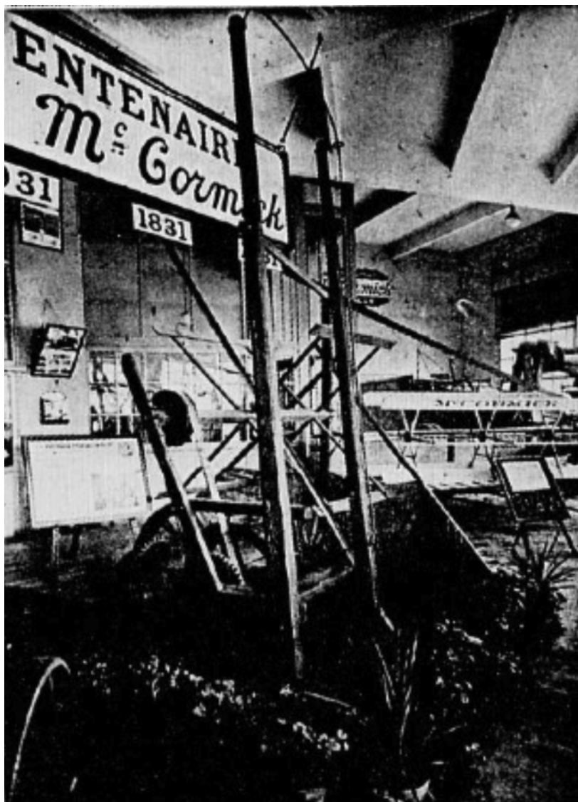
La première moissonneuse construite en 1831 par le fils Mac Cormick.

Cette leçon de choses, arrosée par des bouteilles de champagne, fut la plus instructive et la plus agréable des leçons. Et les colons qui en furent les bénéficiaires conserveront de cette séance un souvenir amical.