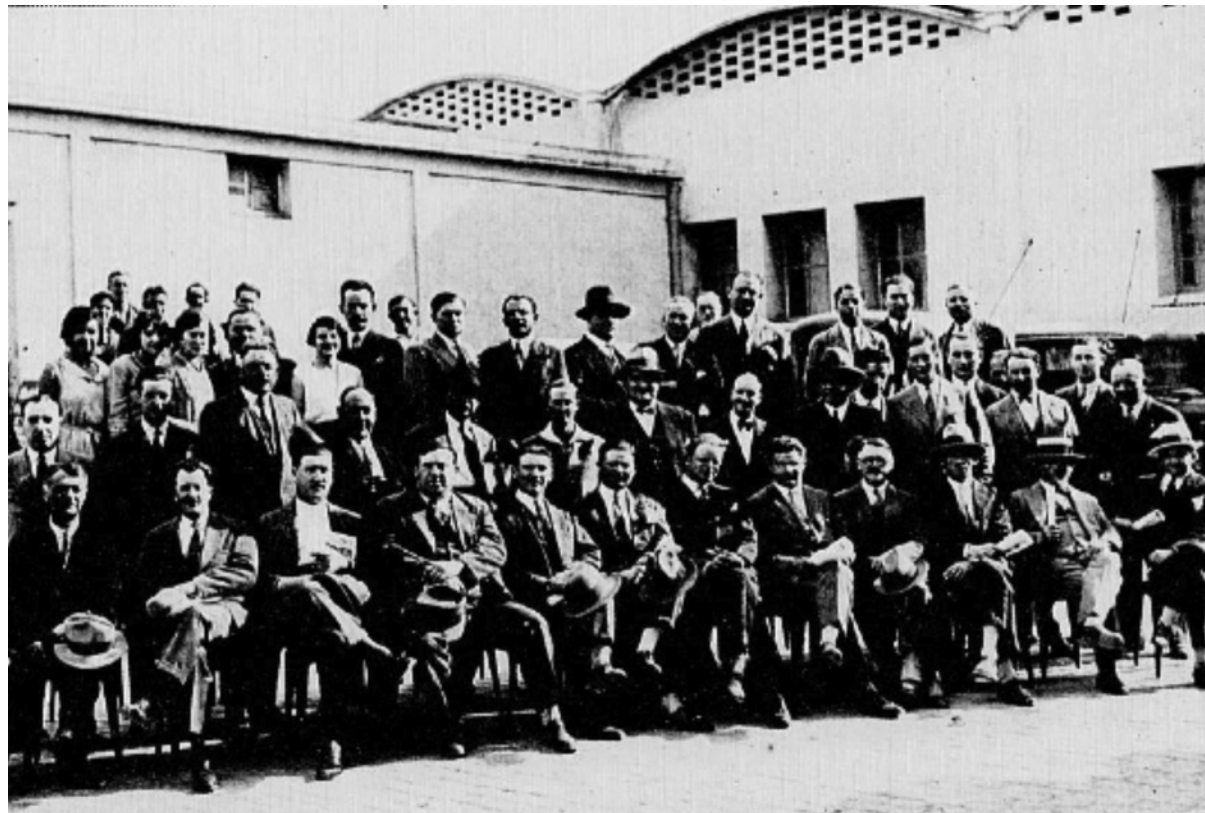
Dans la cour des Établissements Wallut, de Casablanca : Un groupe de colons et d'amis