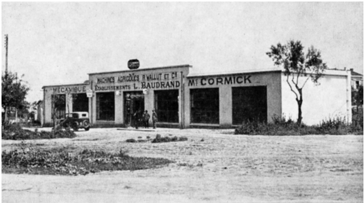
Agence de Meknès : Éts L. Baudrand