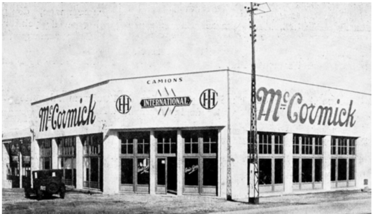
Agence de Rabat.