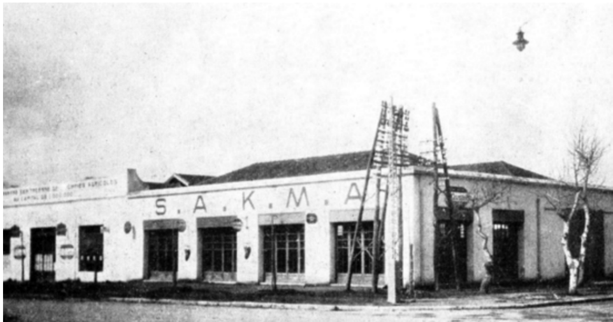
Agence de Kénitra : SAKMA

1934 : fusion avec CIMA (International Harvester).