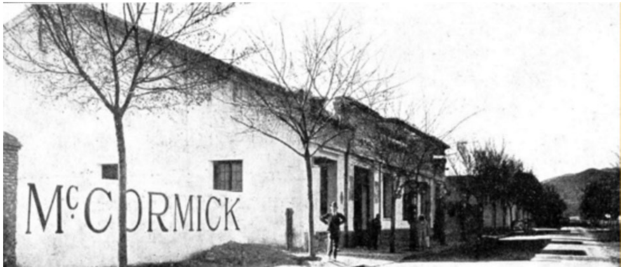
Agence de Fès.