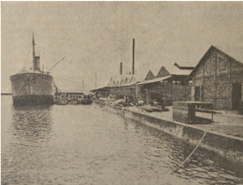
Fig. 1. — Wharf de l'usine et vapeur « Lyndiane » pendant un chargement

L'usine de Lyndiane, comprenant un abattoir industriel et un frigorifique, a été créée en 1914 par la Société française d'alimentation de Chanaud et Cie. L'idée de cette entreprise a été suggérée à ses fondateurs par la crise de vie chère, qui commençait à se faire sentir dès 1912 et, au moment où les barrières douanières s'opposaient à l'importation des viandes étrangères, la possibilité se présentait d'utiliser les richesses en cheptel de l'Afrique Occidentale française.