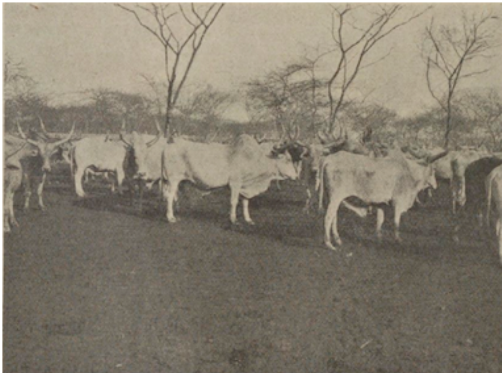
Fig. 16. — Un troupeau de bœufs de race « Gobra » dans un des parcs de l'usine.

D'ailleurs peu de mois après, le gouvernement français promulguait un décret interdisant l'importation des viandes congelées en provenance du Sénégal.