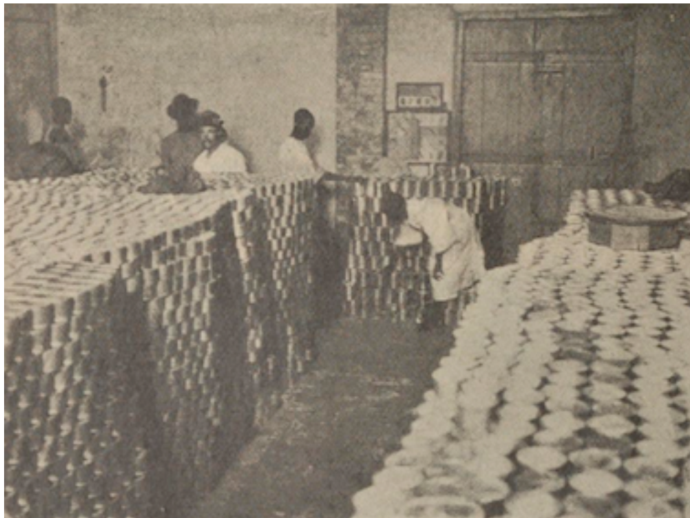
Fig. 14. - Salle de mise en observation et de vernissage des boîtes de conserves.

Cette viande convenait admirablement à la préparation des conserves.