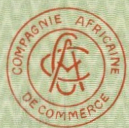
COMPAGNIE AFRICAINE DE COMMERCE (ANCIENS ÉTABLISSEMENTS A. LECOMTE) Société anonyme au capital de 15.000.000 de francs