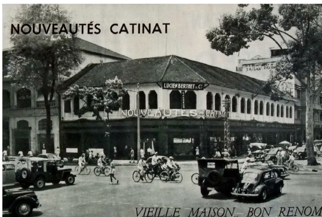
(Indochine-Sud-Est asiatique, juin 1953)