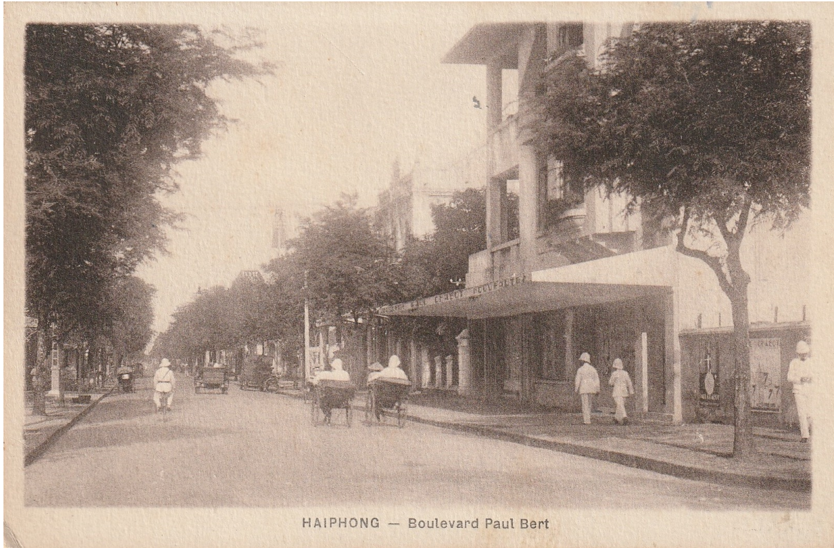
HAIPHONG — Boulevard Paul Bert