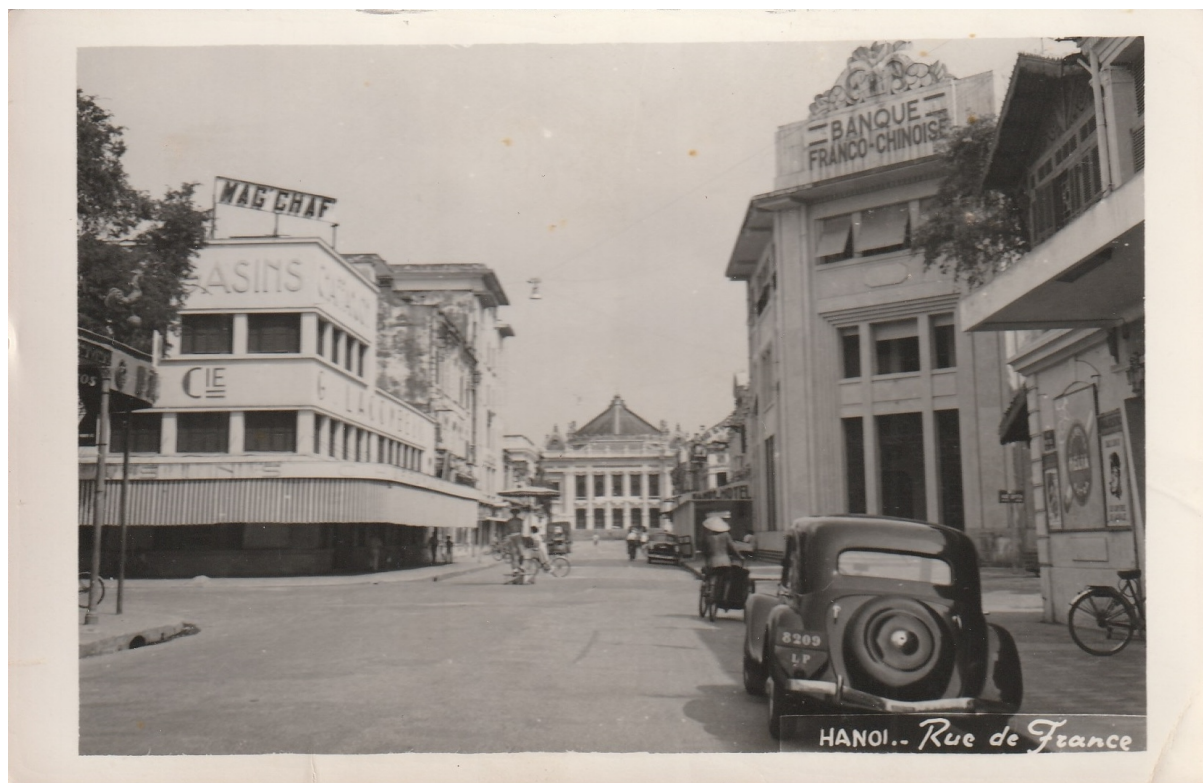
Coll. Olivier Galand Mag'Chaf' G. Lacombe Les magasins Chaffanjon à Hanoï