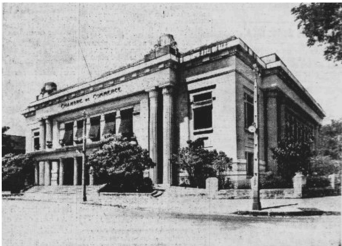
Imposante, certes, la chambre de commerce de Saïgon, mais qui rappelle trop le « style exposition ».