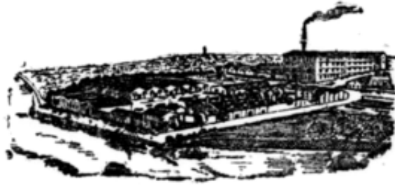
Médaille d'or Hanoi (Exposition de 1902)

Distilleries et entrepôts de Jules ROBIN & Cie Cognac (France) Médaille d'or Hanoi (Exposition de 1902)