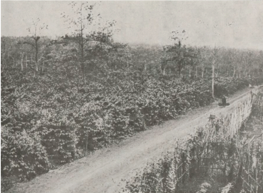
Une vue de caféiers au Tonkin Société agricole et forestière de Yen-My

Aux vitrines des libraires s'étale en ce moment un volume portant ce titre : l'Épopée du caoutchouc .