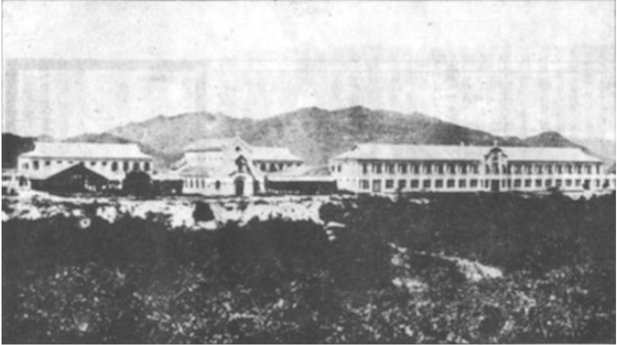
Les deux plus récentes installations des frères des écoles chrétiennes : le noviciat des frères à Nhatrang, et le Sacré-Cœur de Dalat, en voie d'achèvement.