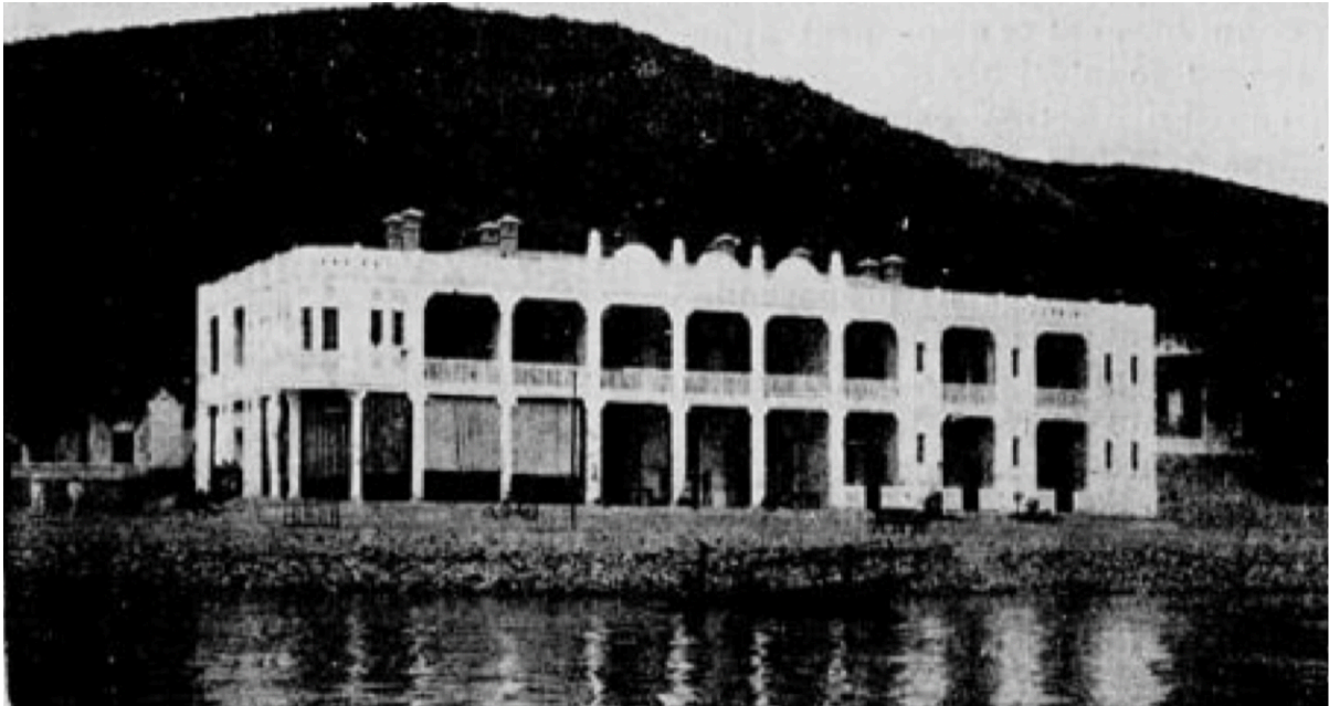
L'Hôtel des Mines vu de la baie

[...] Hongay a l'avantage, d'aucuns diront l'inconvénient, de se trouver en pleine baie d'Along, cette merveille tant chantée en vers et en prose et qui, depuis trente ans, eût attiré des milliers de touristes s'il y avait eu moins de poètes, mais ne fût-ce qu'un embryon d'organisation.