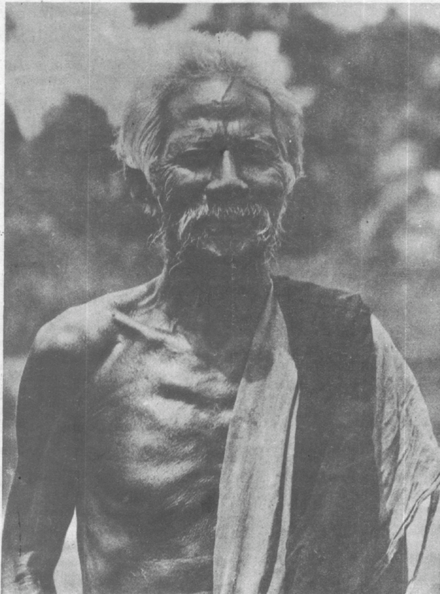
Type de vieux pêcheur cambodgien.

Édité par l'Association Alexandre-de-Rhodes, 6, avenue Pierre-Pasquier, Hanoi Gérant : Truong-Cong-Dinh