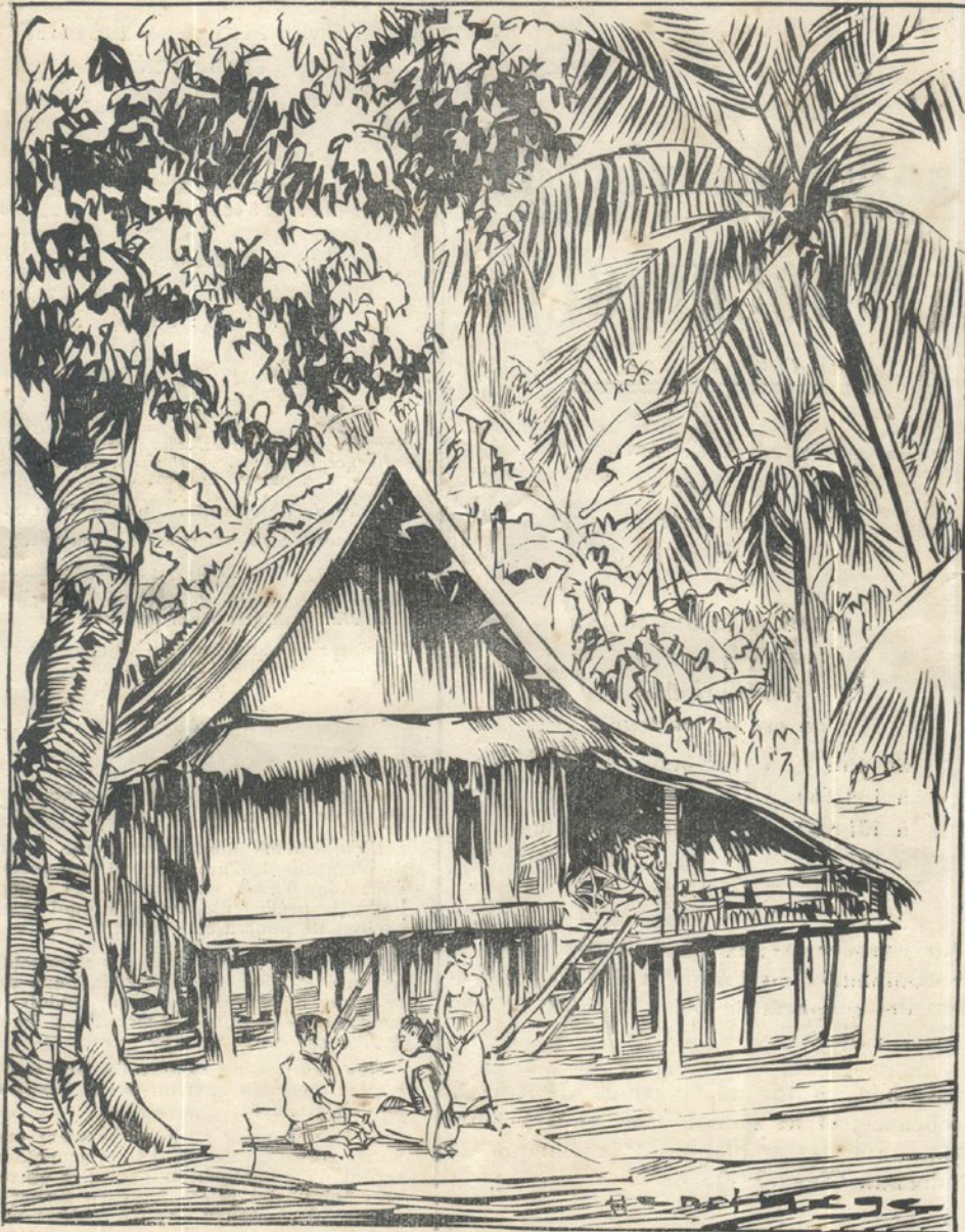
Maison laotienne à Không.

(Bois gravé d'après un dessin de Henri Mège.)