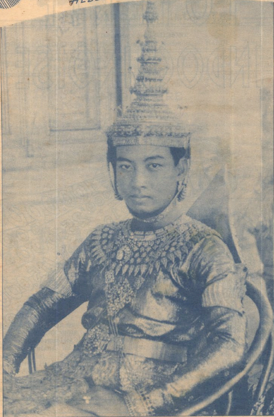
S. M. NORODOM SIHANOUK.