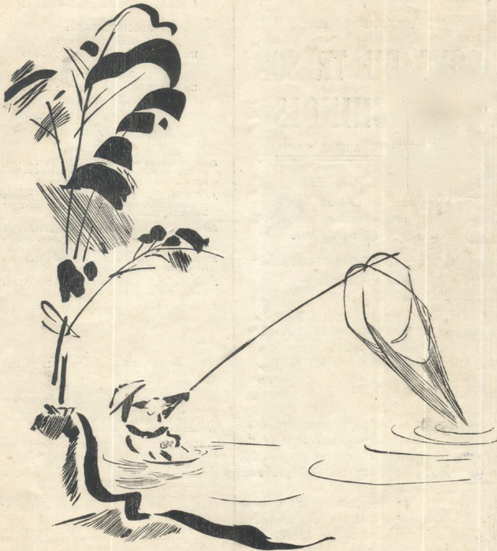
Pêche au carrelet.