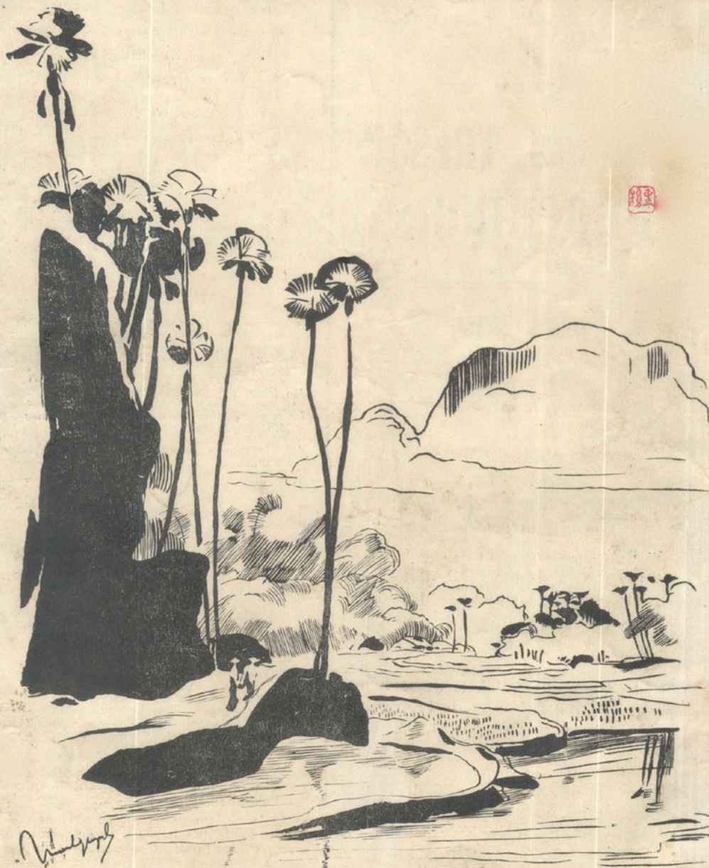
TONKIN. — Paysage à Phutho.