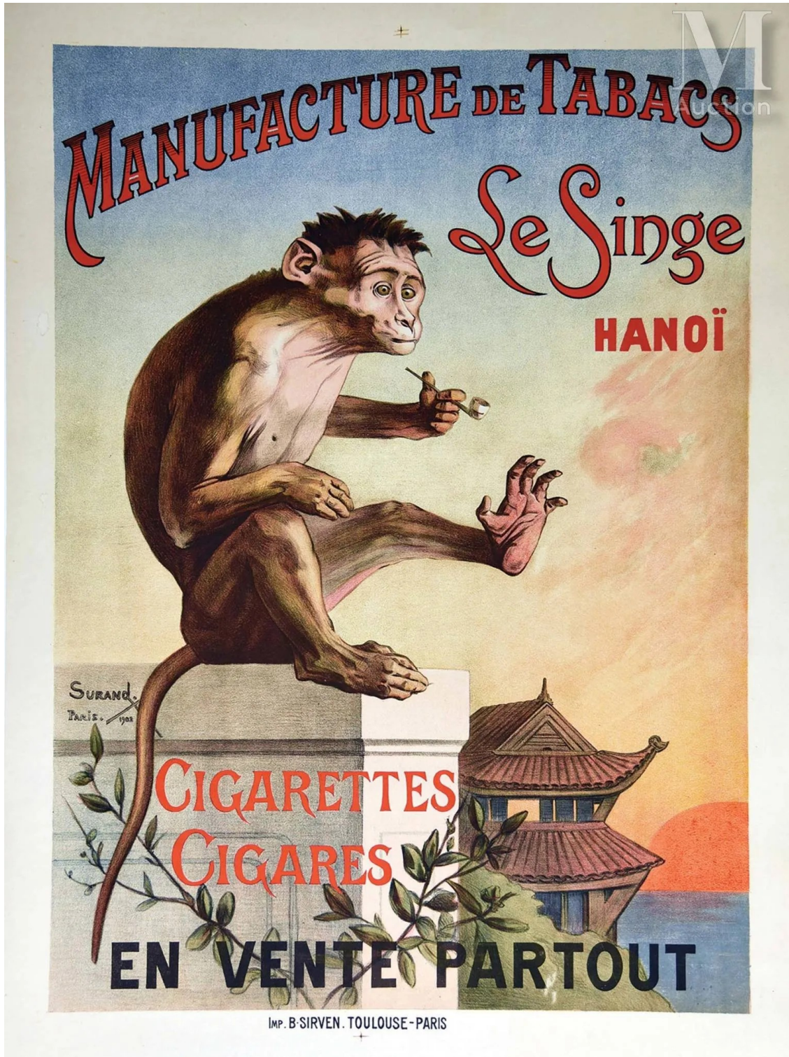
Manufacture de tabacs Le Singe, Hanoï Surand, Paris, 1908. Imp. B. Sirven, Toulouse-Paris