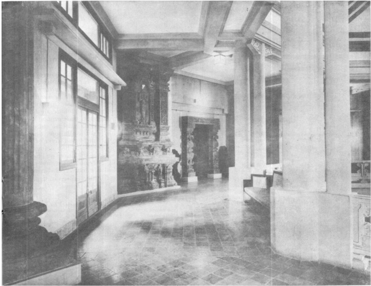
Au 1 er étage, la galerie pourtournante des grandes reconstitutions moulées : la partie consacrée à l'art cham.