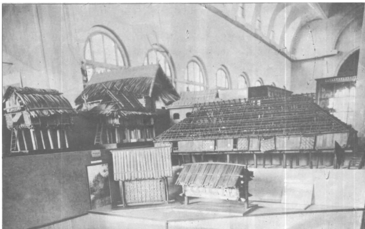
Un coin de l'ensemble des maquettes représentant les diverses habitations indochinoises. Ici l'on voit celles du groupe thai-muong du Nord-Annam.