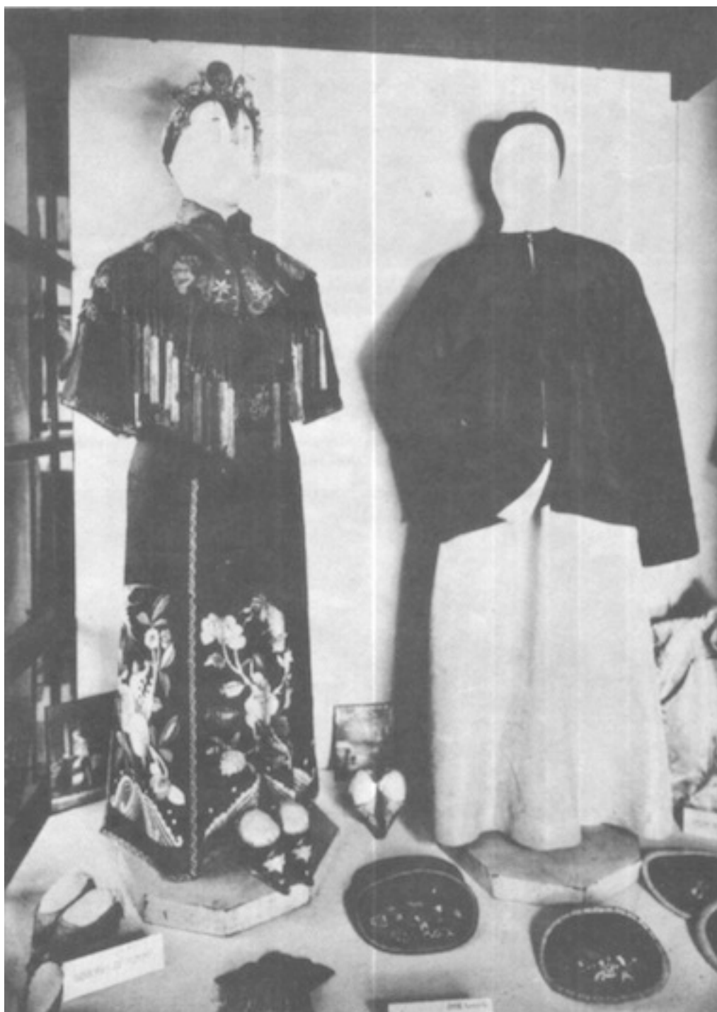
Un couple de bourgeois chinois du Yunnan. La femme est en vêtement de mariée.