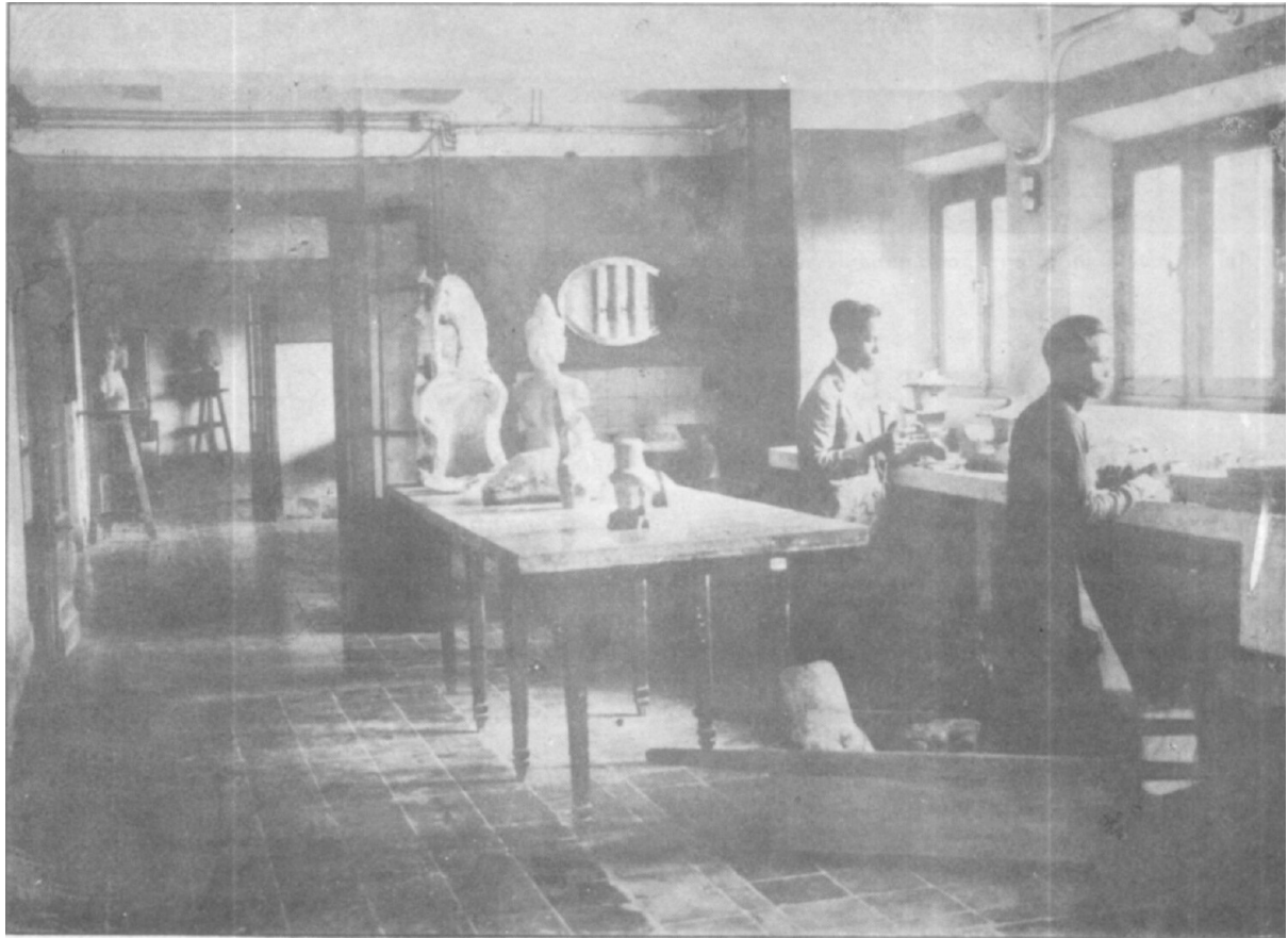
Un des laboratoires du rez-de-chaussée. Ici, les divers moulages exécutés dans les ateliers sont parachevée et les bronzes sont réparés.