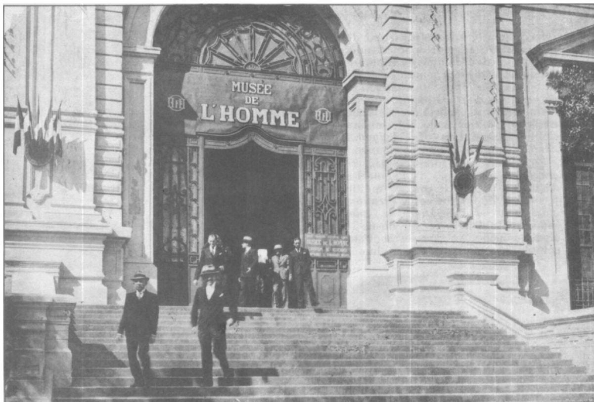
Entrée du Musée de l'Homme (aile gauche du Musée Maurice-Long) au moment de son inauguration, en décembre 1938.