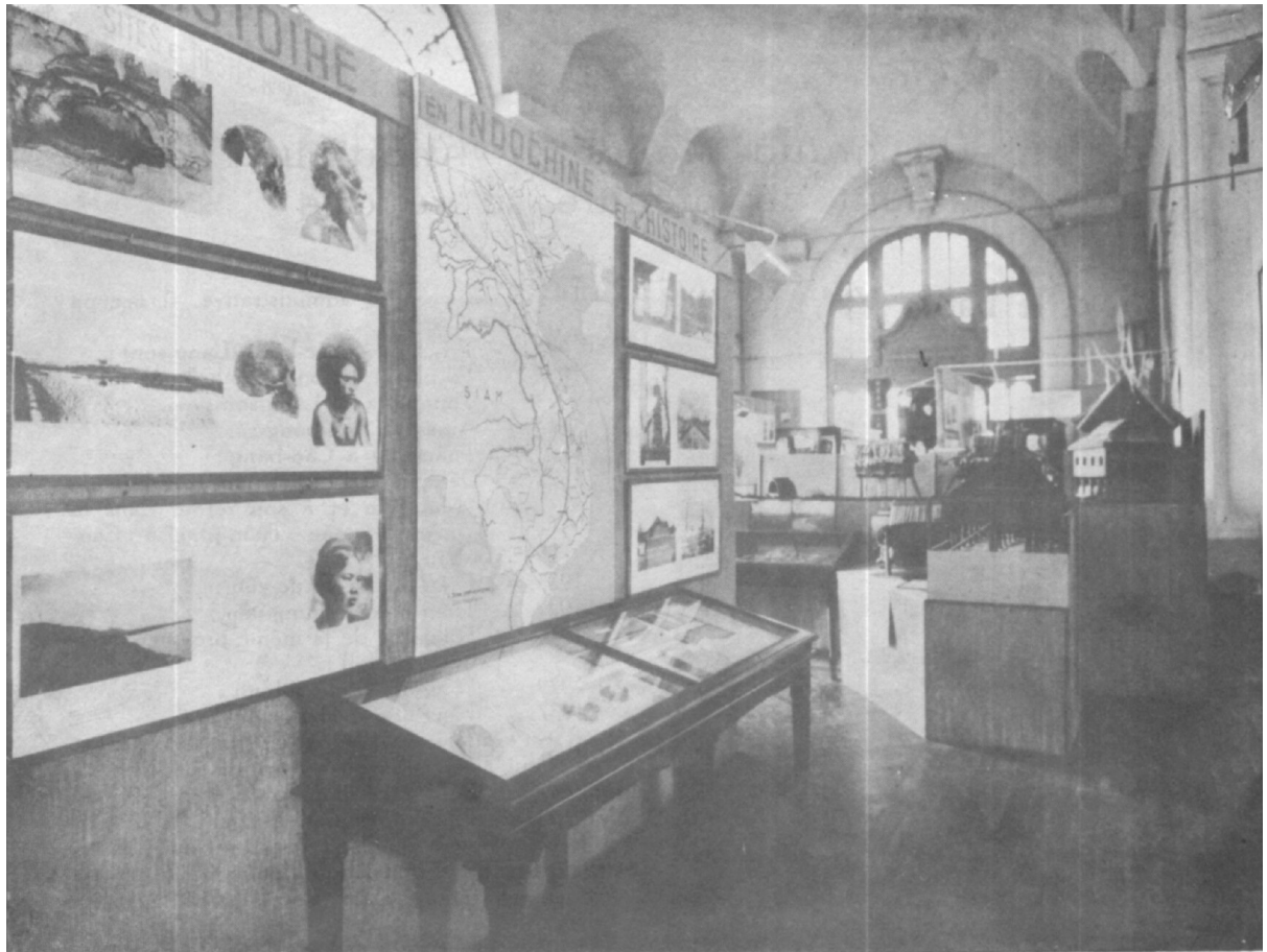
La préhistoire et l'histoire en Indochine résumées par panneaux-photos, documents sous vitrine, et carte.