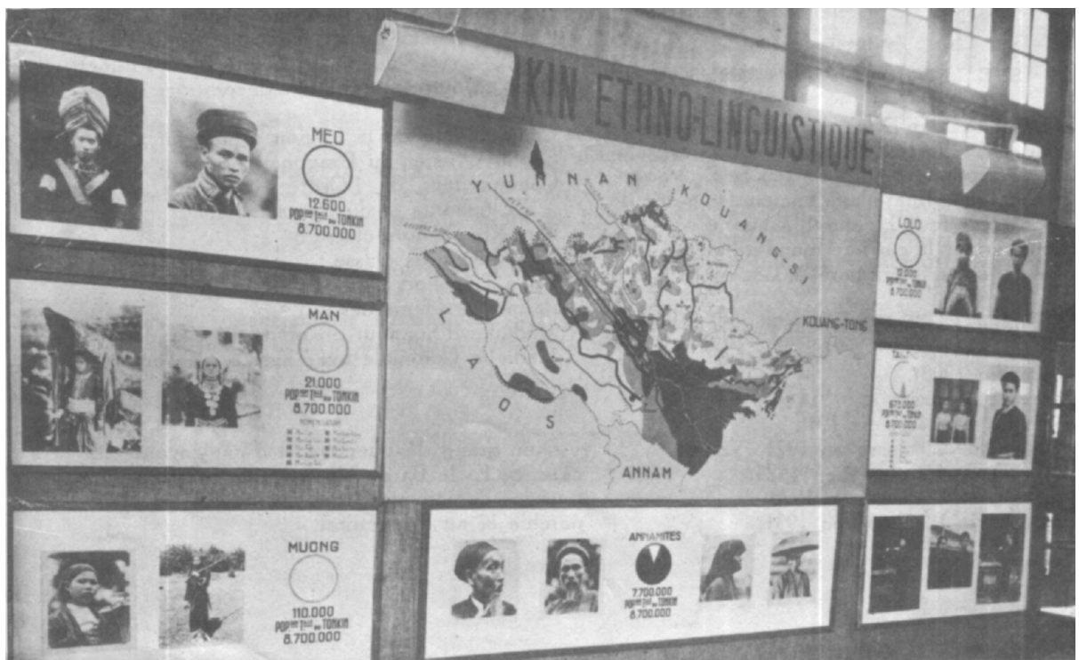
Un grand panneau résumant par photos et carte la répartition des divers groupes ethniques peuplant le Tonkin.