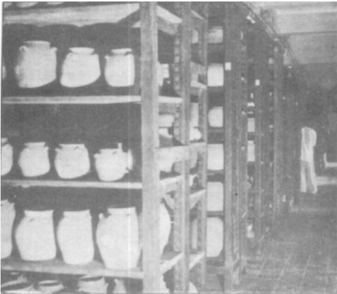
Les réserves archéologiques du rez-de-chaussée. Partie ancienne doublée actuellement d'une série de rayonnages métalliques en voie de montage.

Les combles de l'édifice entier sont aménagés en dépôts archéologiques.