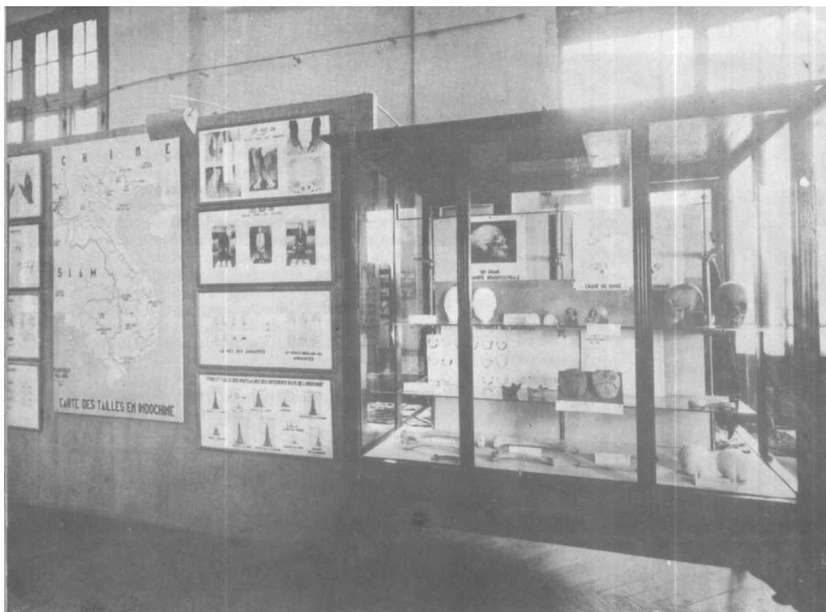
Panneau et vitrine consacrés à l'anthropologie des races indochinoises et montés avec la collaboration du Laboratoire d'anthropologie de l'Université de Hanoï (Directeur : M. le professeur-docteur P. Huard).