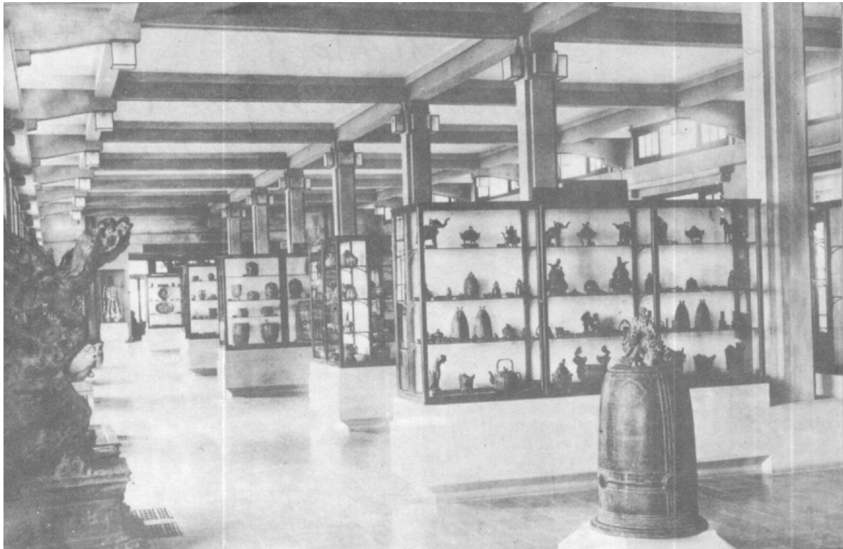
Ensemble de vitrines dans la salle consacrée aux civilisations de culture chinoise. Remarquer le modernisme des vitrines métalliques, leur éclairage et la présentation des objets.

Ce rôle du musée moderne tel que le monde entier l'a maintenant compris, l'École française d'Extrême-Orient l'avait saisi, au début même de sa propre création, en 1898. Mais des circonstances diverses, en majeure partie d'ordre budgétaire, avaient empêché, jusqu'à 1932, de présenter dignement les admirables collections archéologiques que, par ses travaux, ses achats et des dons, l'École française d'Extrême-Orient avait accumulées à Hanoï depuis plus de trente ans.