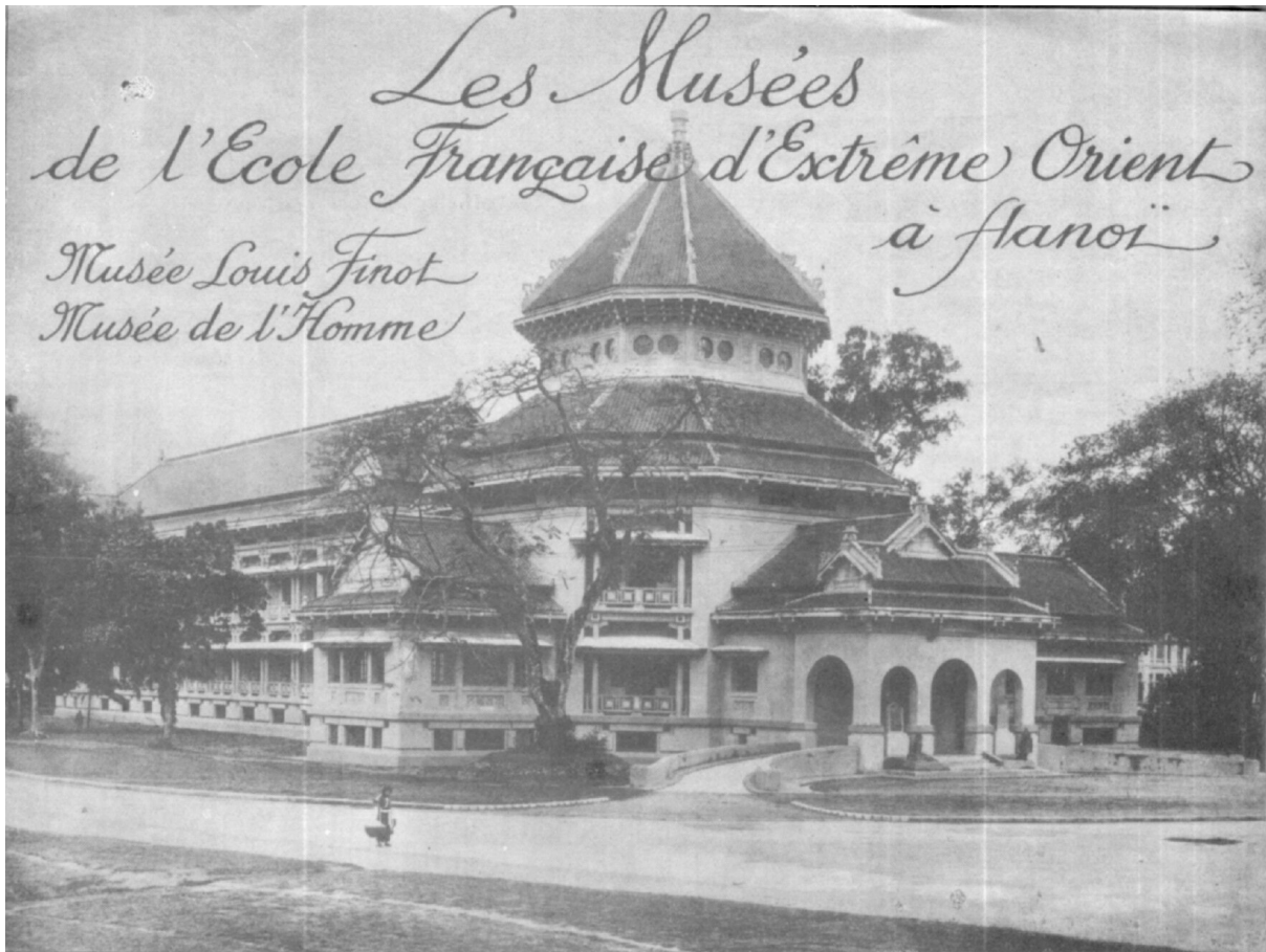
Vue générale du musée Louis-Finot (façade sur la quai du fleuve Rouge).

(Indochine, hebdomadaire illustré, 30 octobre 1941) 1