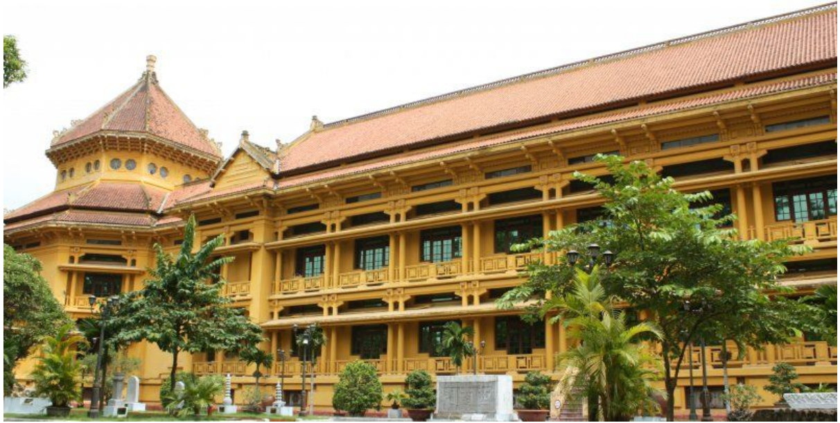
Aujourd'hui, Musée d'histoire vietnamienne