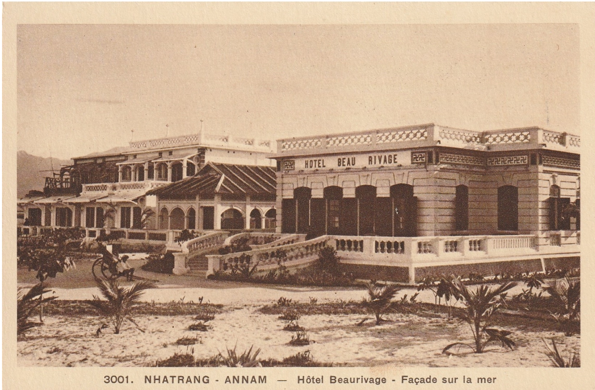
Coll. Olivier Galand Nhatrang. — Hôtel Beurivage. Façade sur la mer (Coll. Nadal. Impr. Braun)