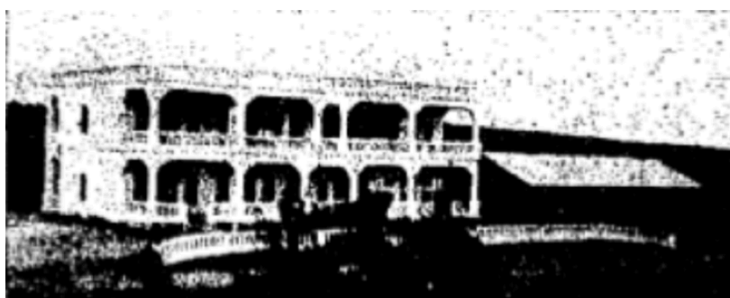
Bâtiment principal. Hôtel Ngoc-Lam, annexe et dépendances.

Songez que, quand on arrive d'Annam pendant la saison sèche, après avoir été souffleté par l'horrible vent chaud du Laos, on éprouve un réel bien-être de sentir la brise fraîche du large soufflant continuellement et qui balaie l'hôtel d'une porte à l'autre. Point n'est besoin de ventilateurs, car ce serait le vent qui les ferait tourner... et produirait du courant.