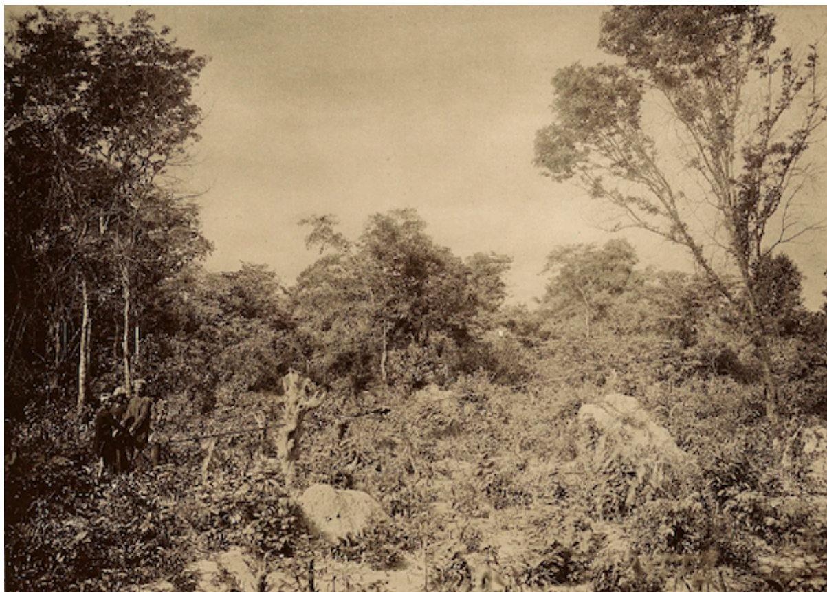
Planche 53. — Défrichement : dessoucheuse en fonctionnement