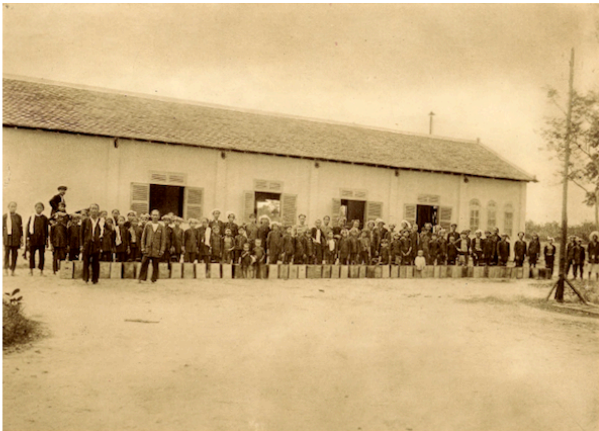
Planche 56. — Arrivée des saigneurs à l'usine avec le latex