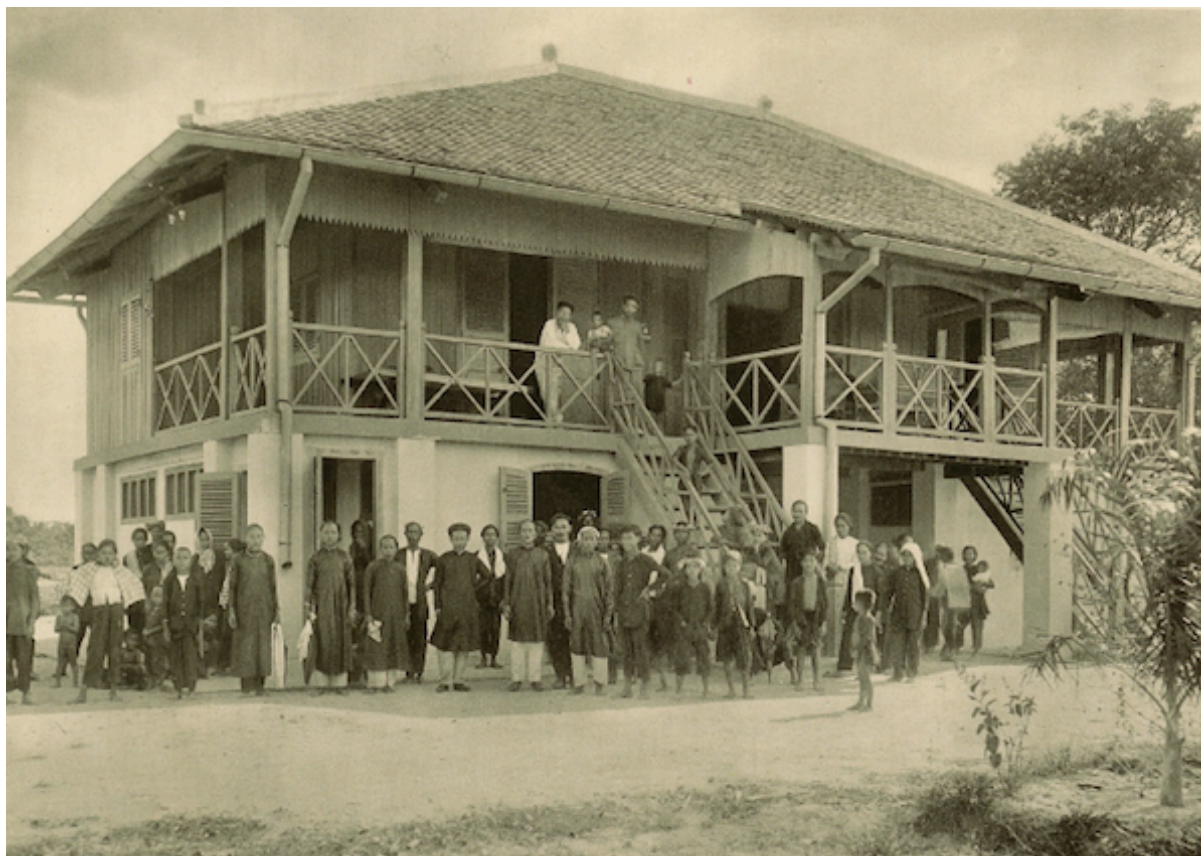
Planche 58. — Maison d'habitation et bureaux