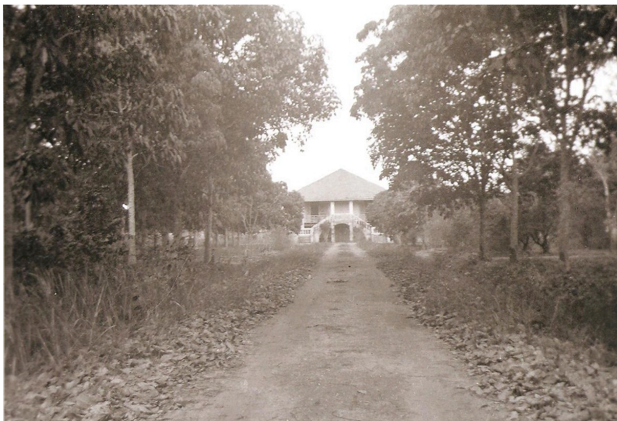
La villa : approche