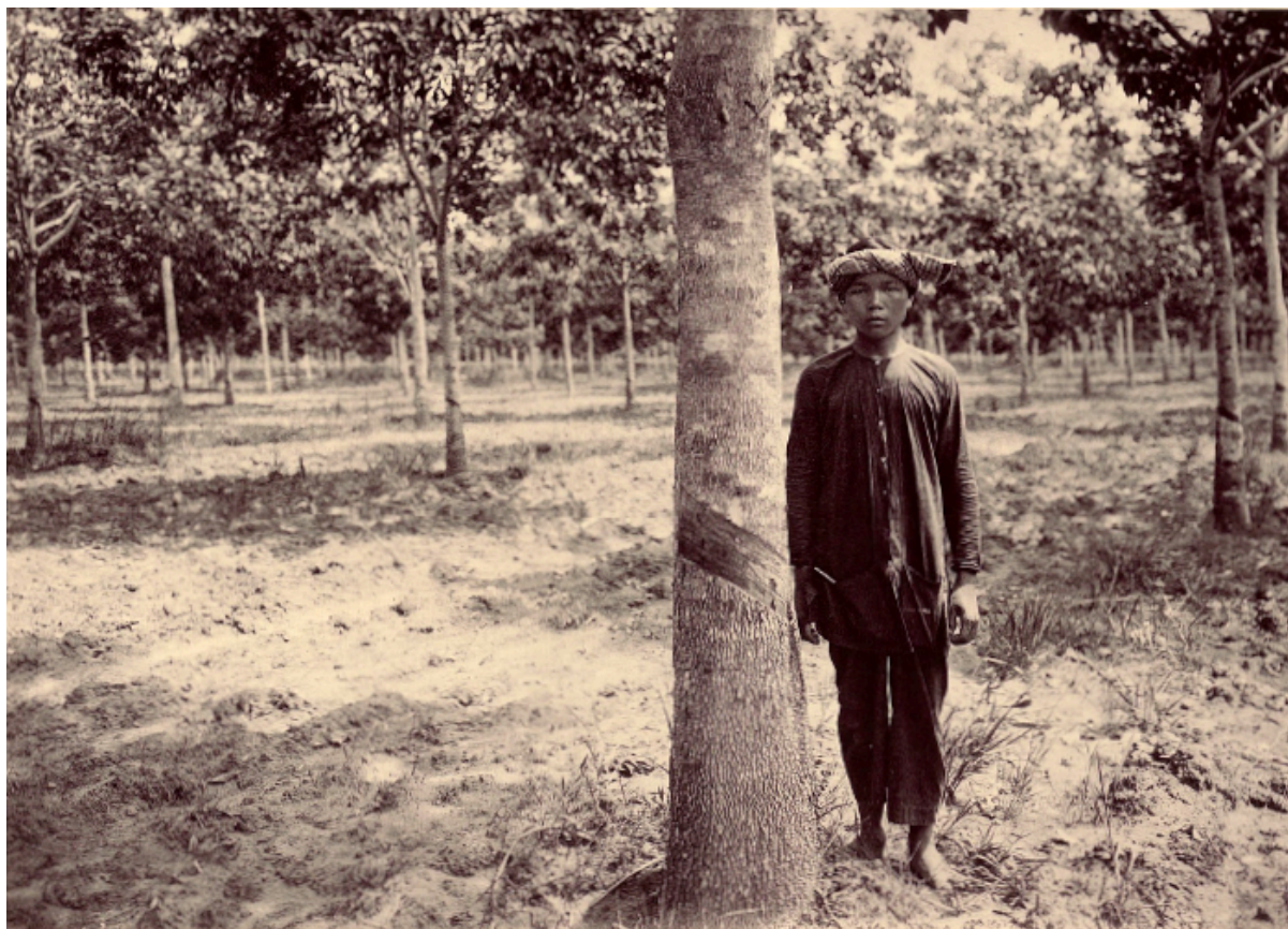
Planche 91. — Arbre de 9 ans.