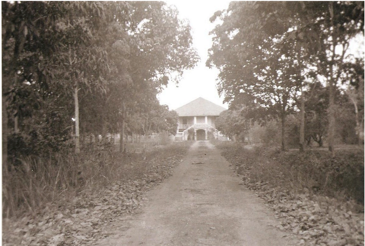
La villa, de loin