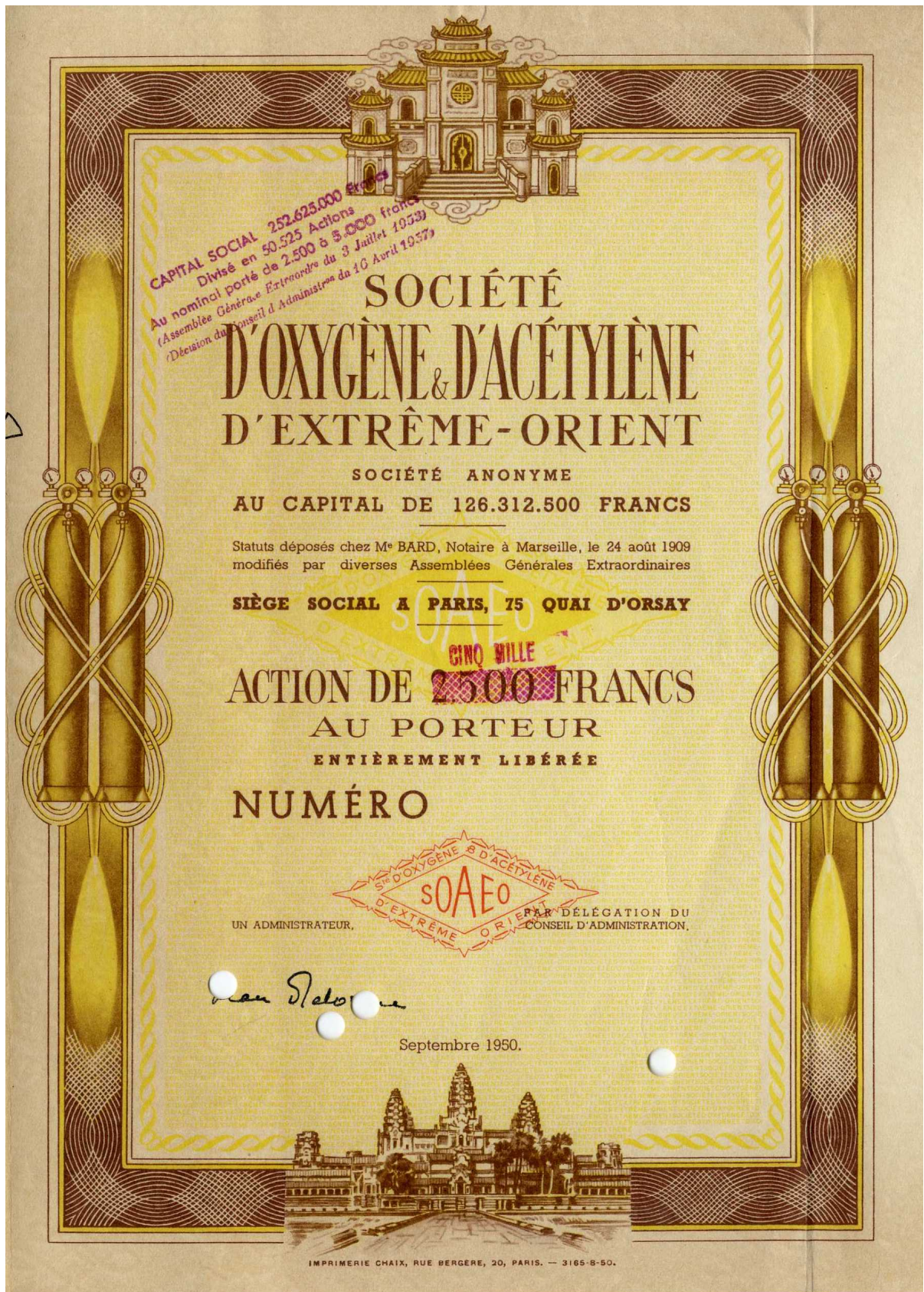
SOCIÉTÉ D'OXYGÈNE ET D'ACÉTYLÈNE D'EXTRÊME-ORIENT Société anonyme au capital de 126.312.500 fr.