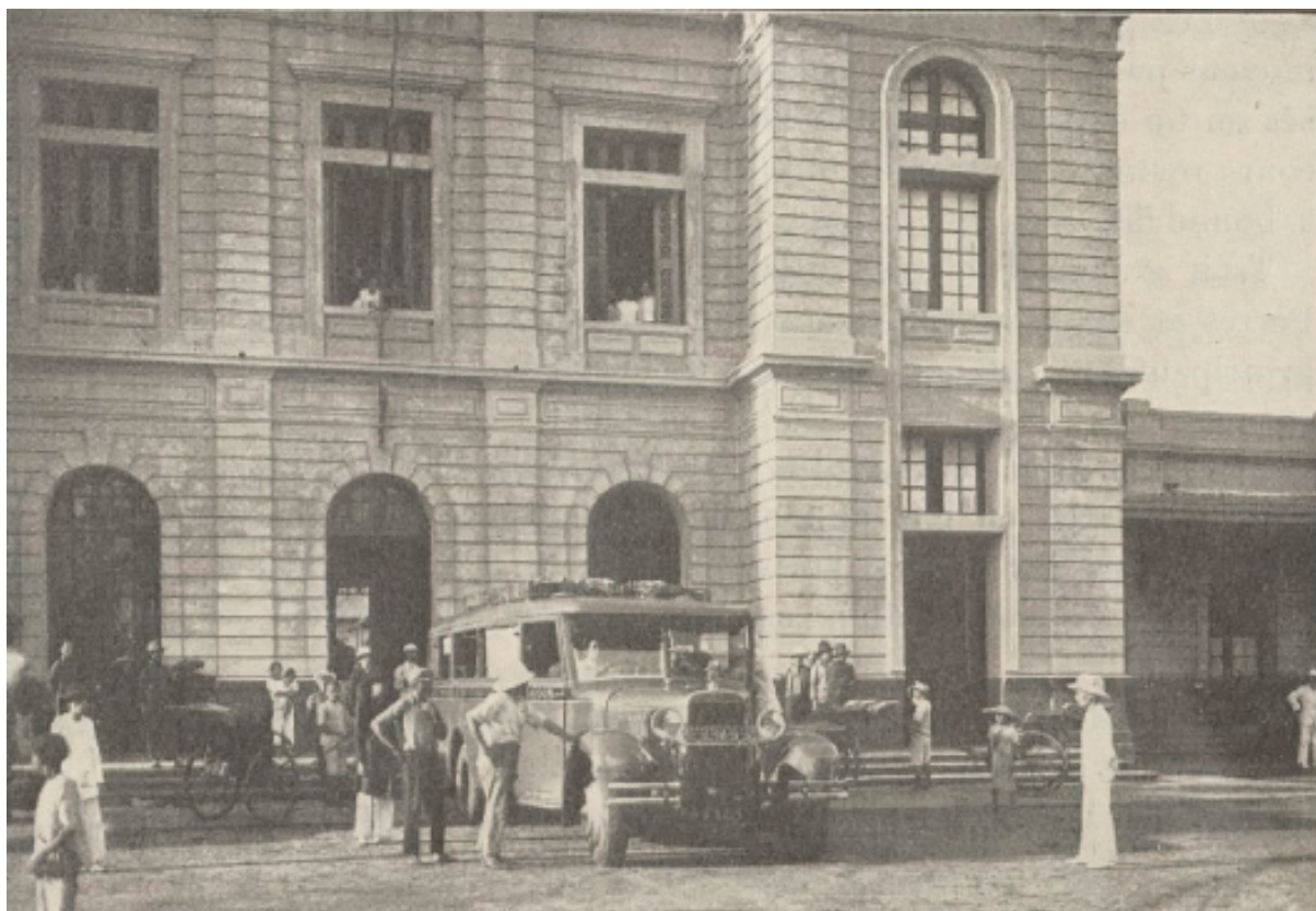
Un autocar de la STACA à Tourane (Bulletin de l'Agence économique de l'Indochine, juillet 1934, p. 259)

(L'Information d'Indochine, économique et financière, 19 juillet 1934)