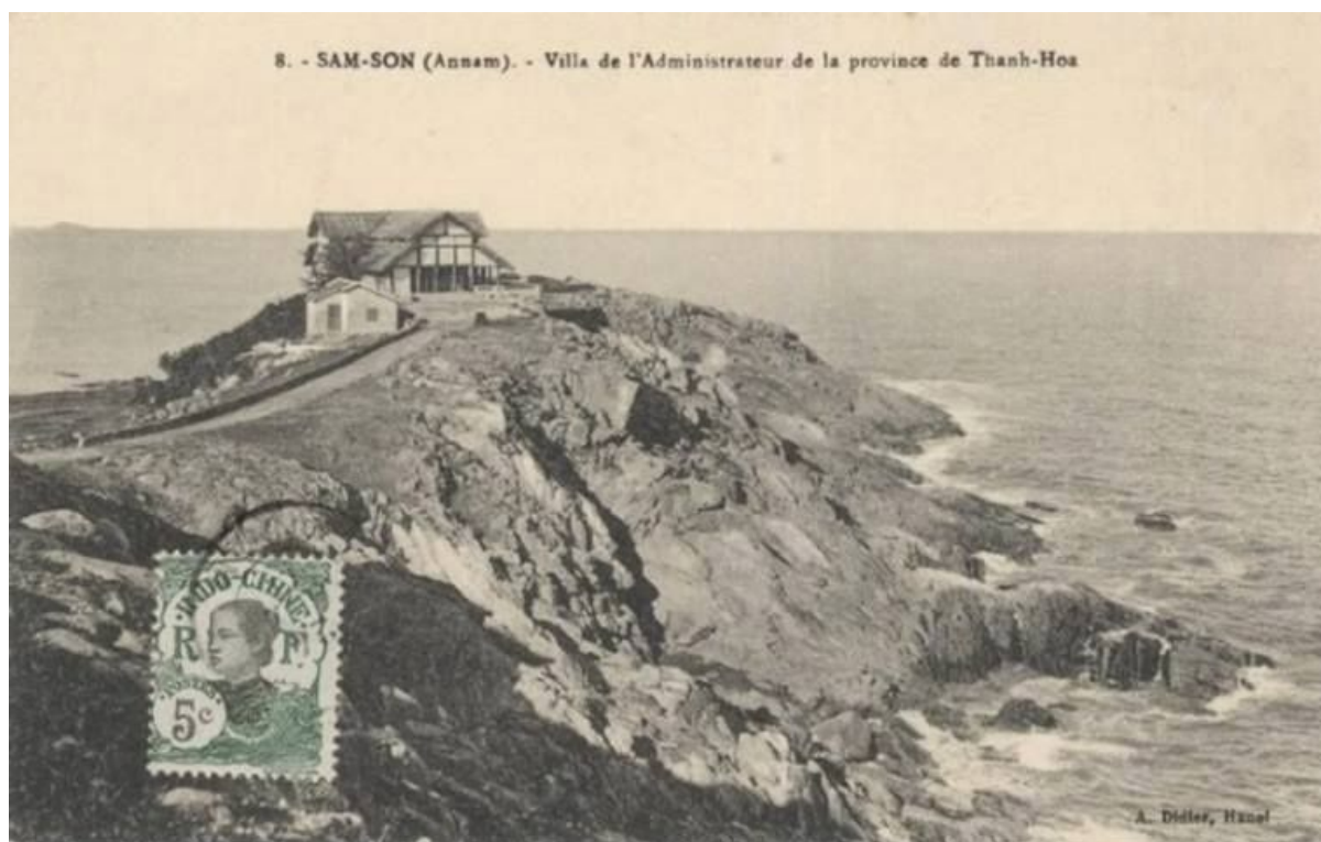
Sam-son (Annam). — Villa de l'administrateur de la province de Thanh-Hoa