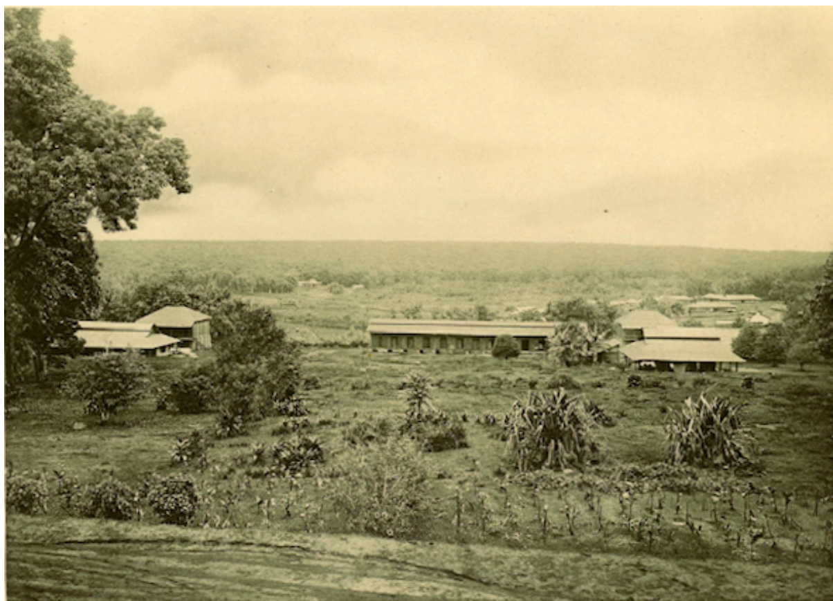
Planche 173. — Xacam. Vue d'ensemble des installations.

Production annuelle : 415.500 kg en 1925.