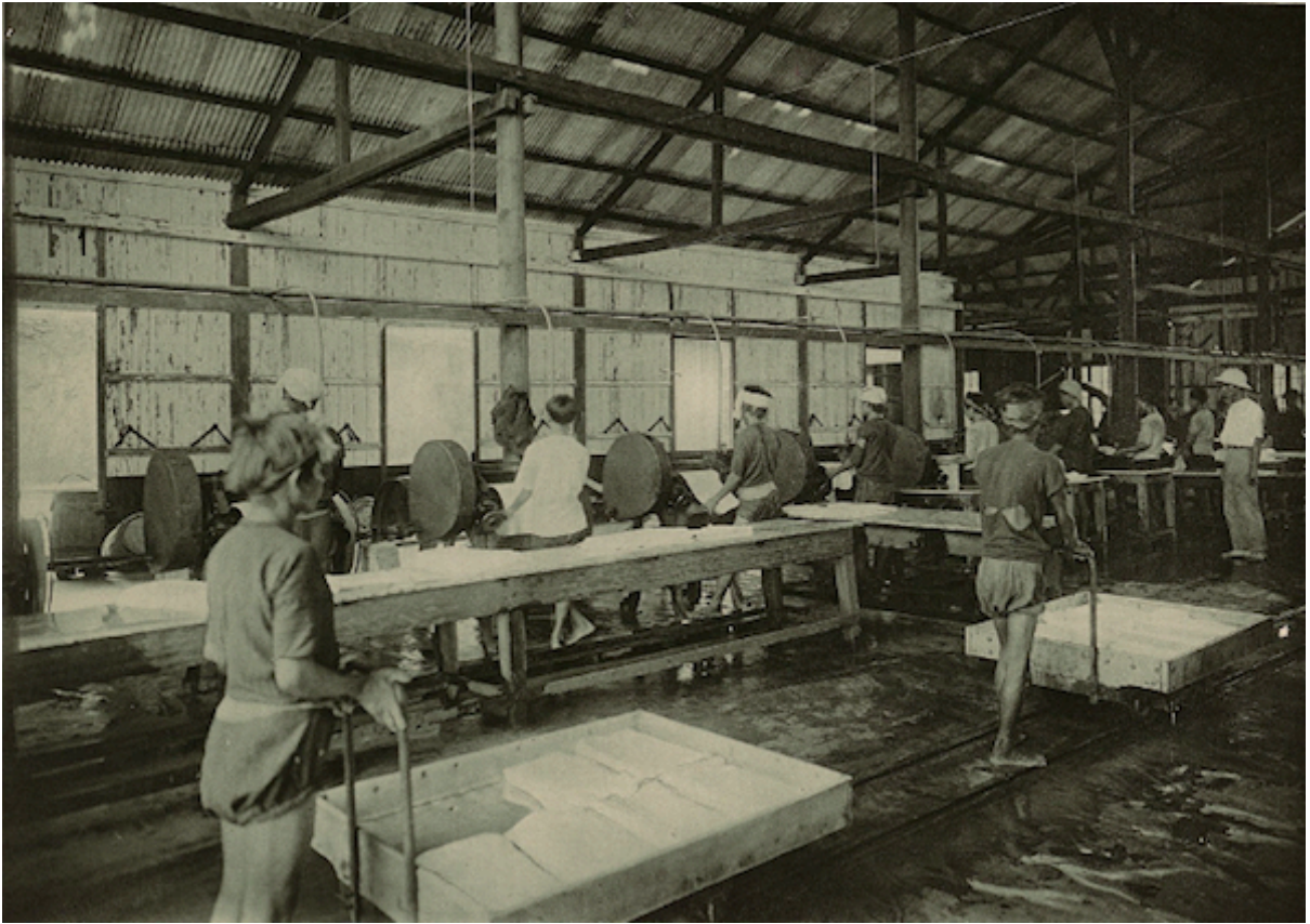
Planche 167. — Quan-loi. Usine.