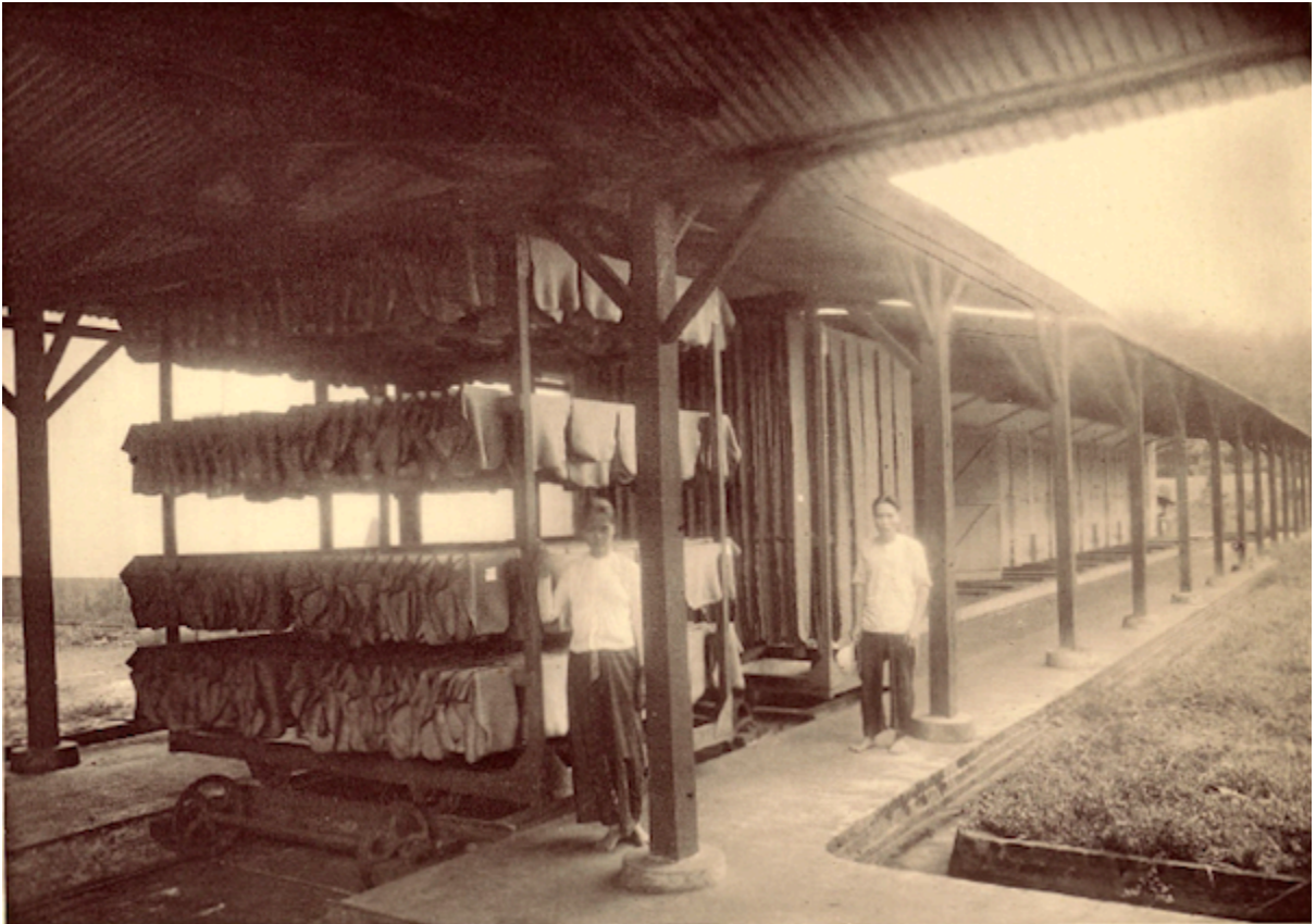
Planche 181. — Xatrach. Séchoir.