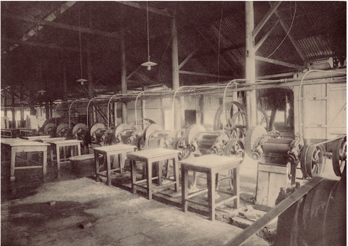
Planche 178. — Xacam. Intérieur de l'usine.