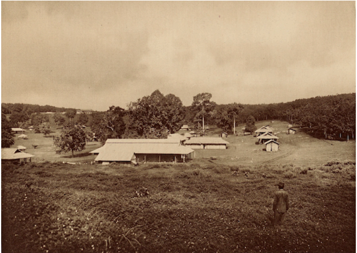
Planche 166. — Quan-loi. Un village tonkinois.