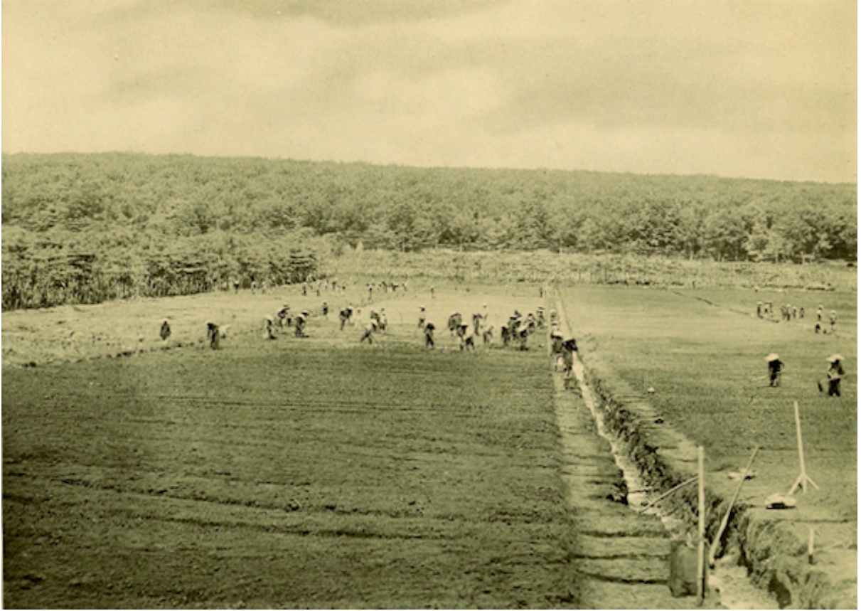
Planche 177. — Xacam. Pépinières d'hévéas.