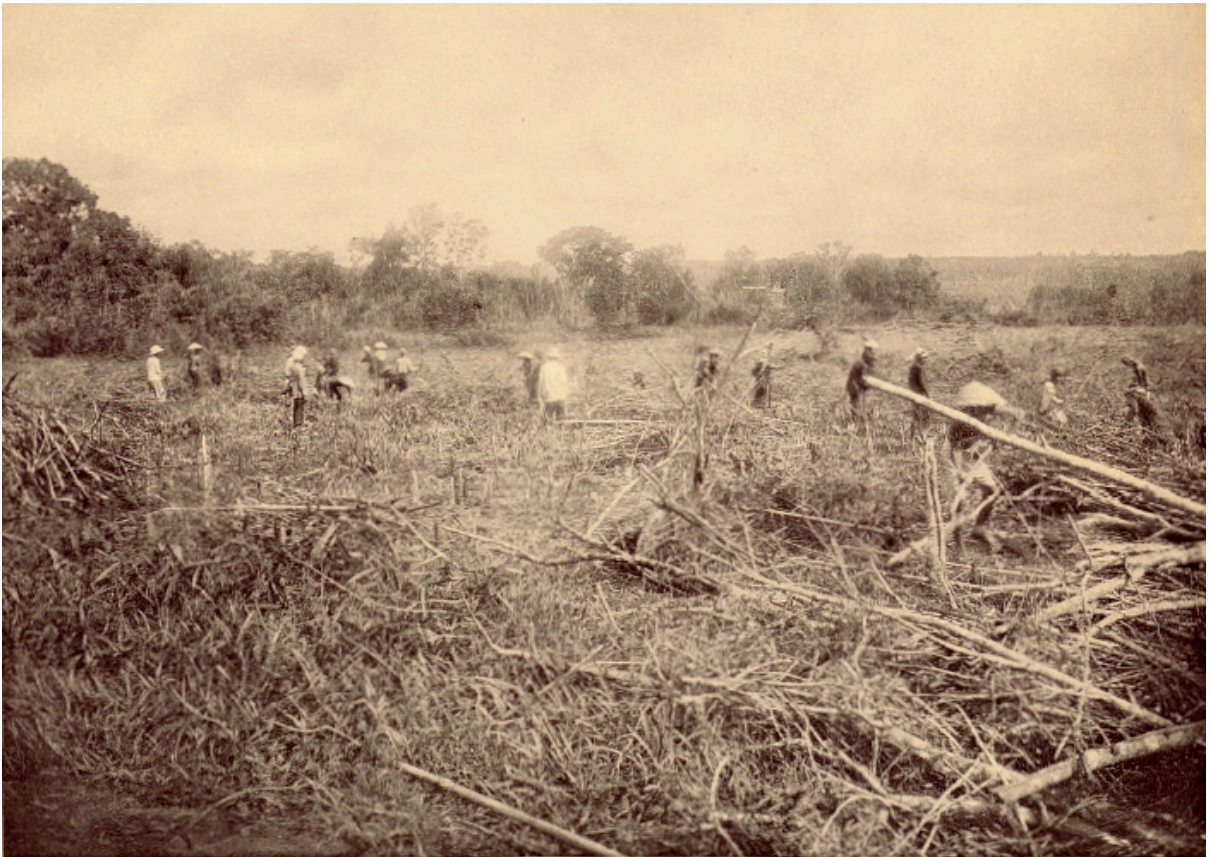
Planche 175. — Xacam. Défrichements.