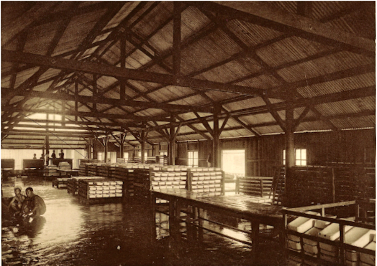
Planche 170. — Quan-loi. Salle de coagulation.