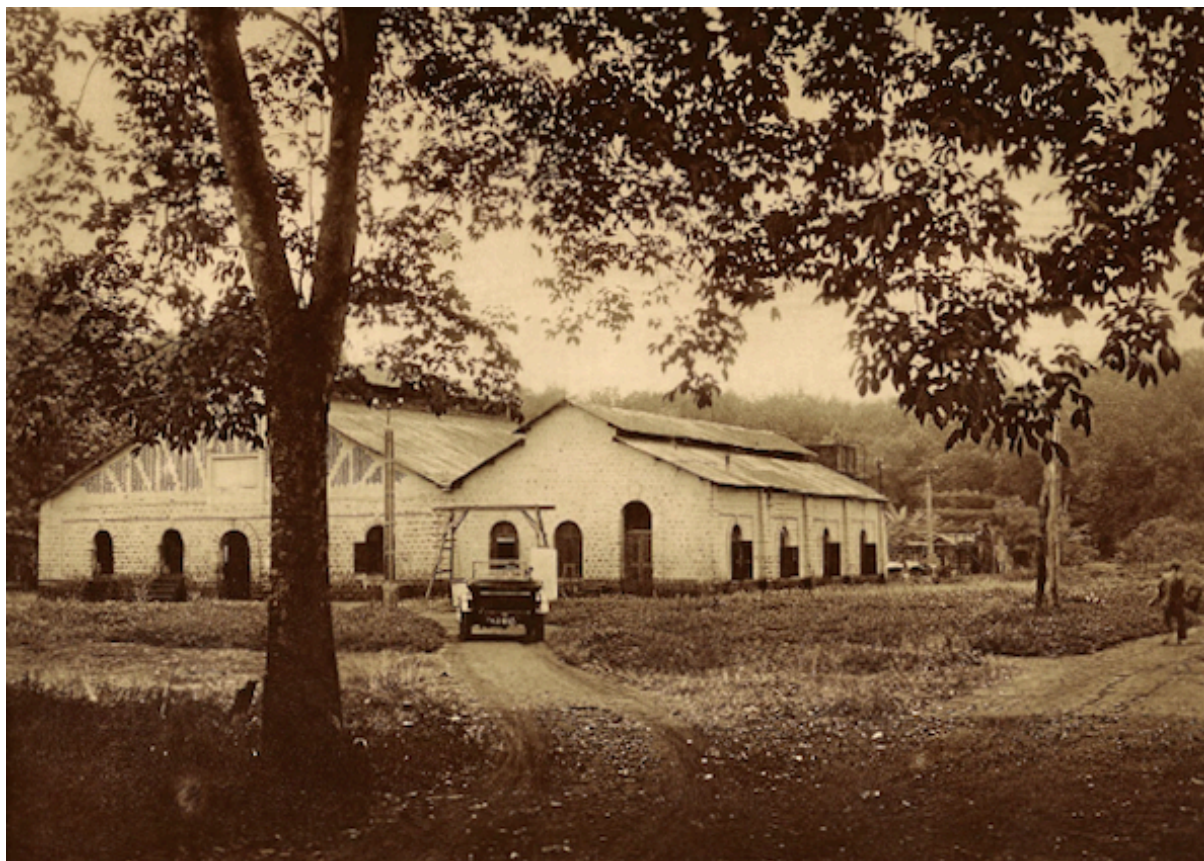
Planche 183. — Xatrach. L'usine.