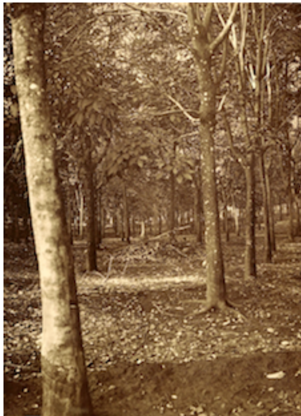
Planche 171. — Quan-loi. Arbre de 10 ans.