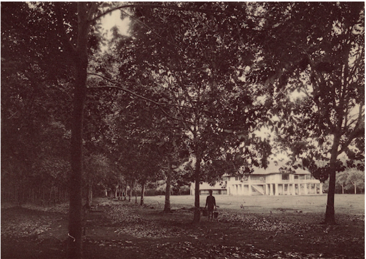
Planche 169. — Quan-loi. Maison d'assistant et arbre de 9 ans.