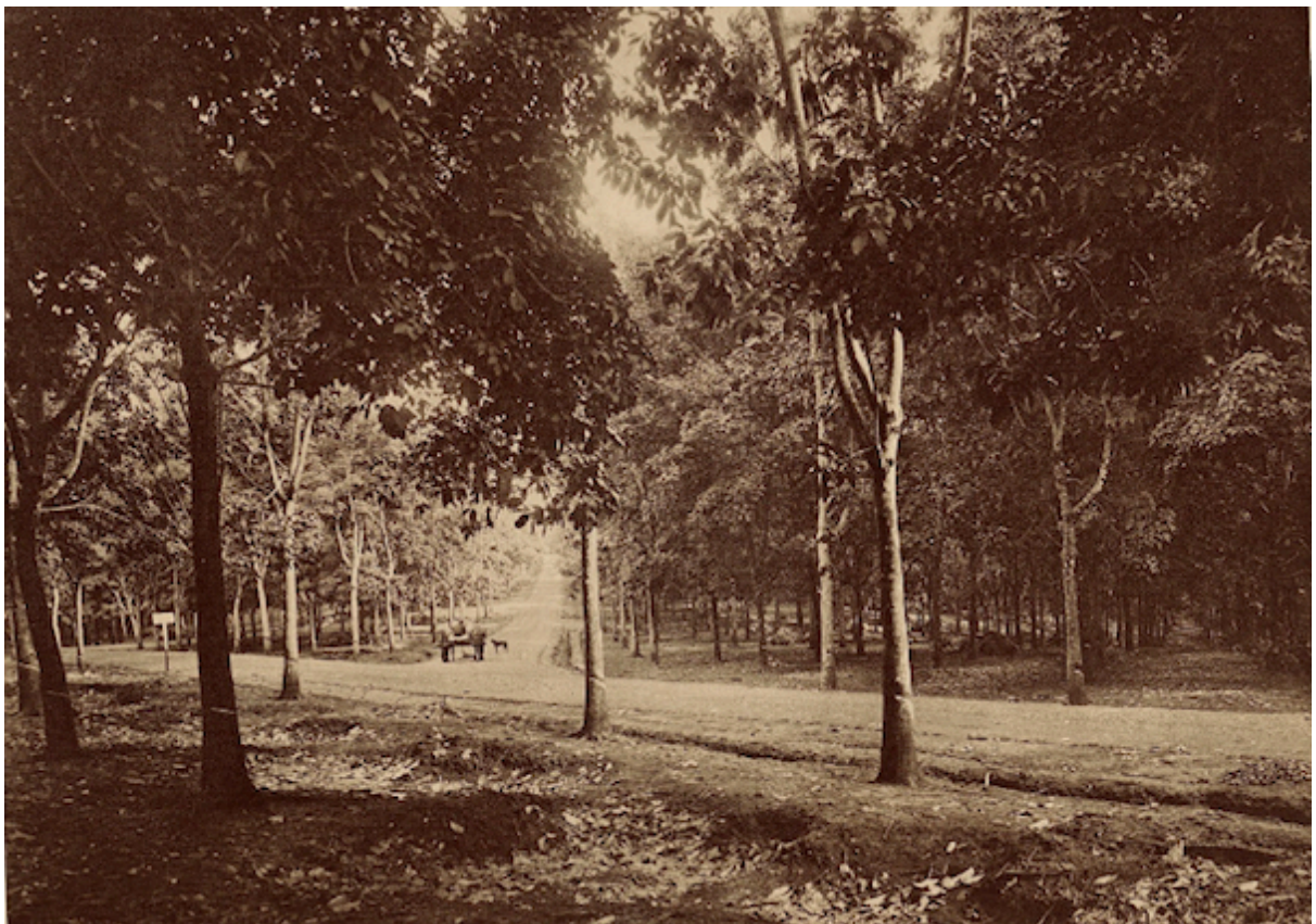
Planche 167. — Quan-loi. Hévéas de 9 ans.