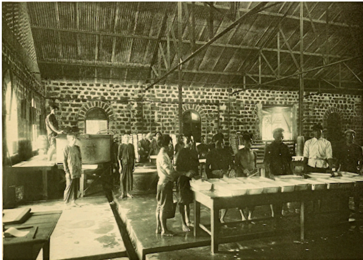
Planche 180. — Xatrach. Coagulation du latex.