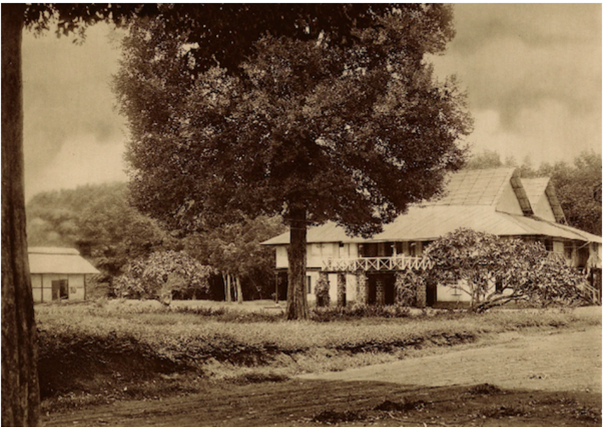
Planche 182. — Xatrach. Maison du directeur.