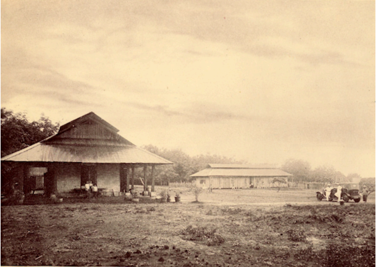
Planche 174. — Xacam. Logements des indigènes.