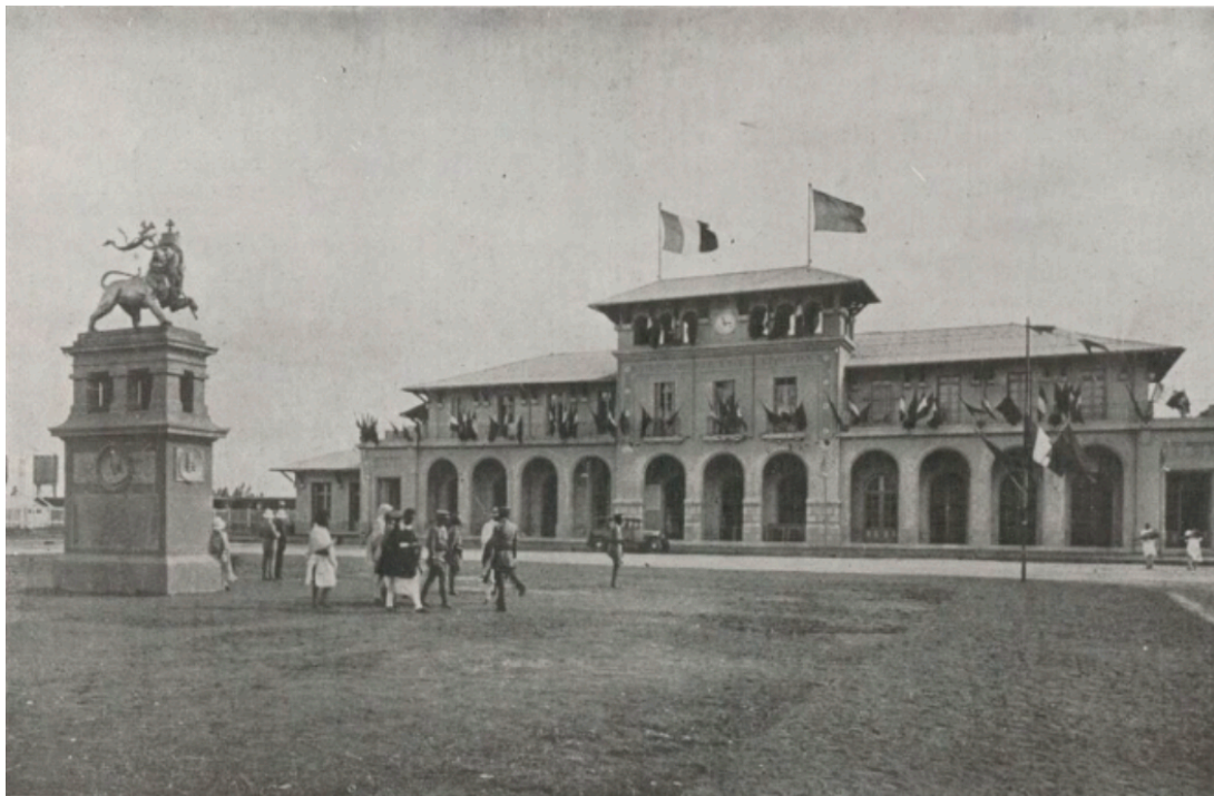
Addis-Abéba : le monument à Ménélick devant la gare.

..... Au point de vue du trafic voyageurs, deux trains faisant le trajet complet en trois étapes journalières successives sont régulièrement mis en marche chaque semaine au départ de Djibouti et au départ d'Addis-Abeba.