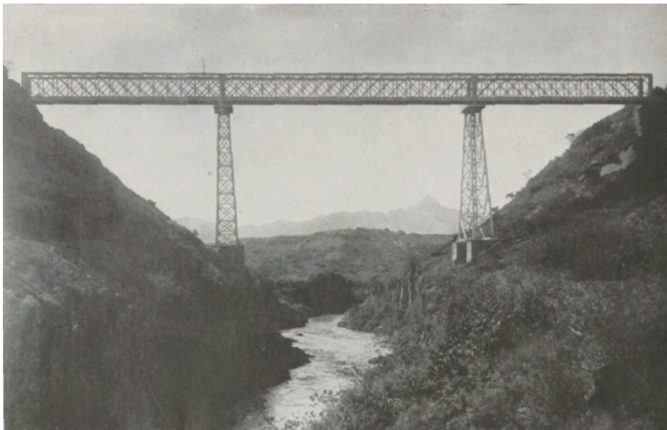
Pont de l'Aouache.