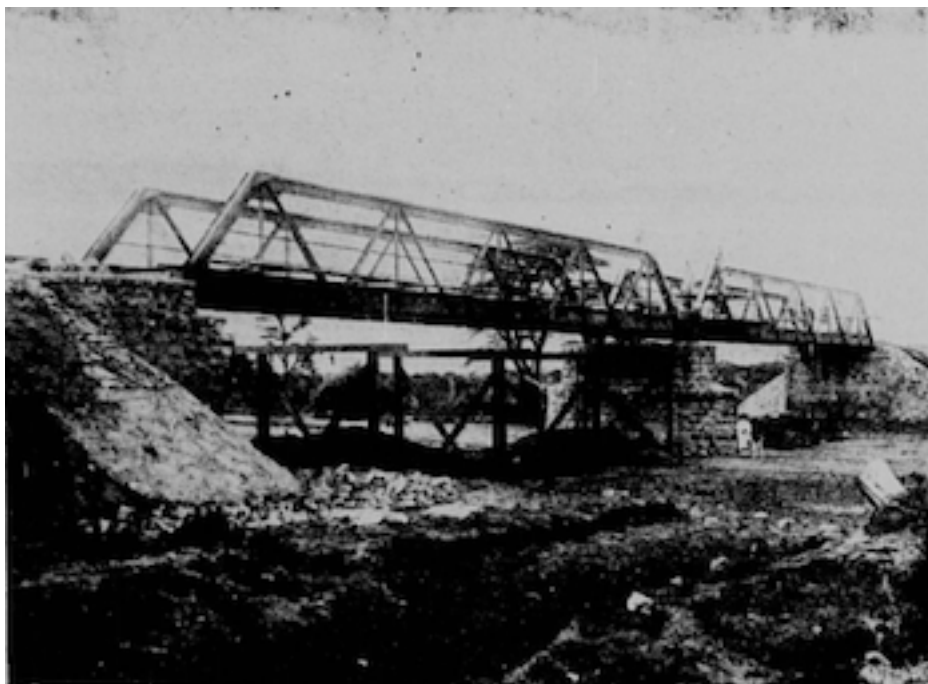
Pont de 2 x 25 m. sur le Laga Oda

Aujourd'hui, la tâche que la Compagnie doit encore accomplir apparaît comme devant être rapidement menée à bien; le rail franchira en effet l'Aouache (km. 232) dans le courant du présent mois et, d'ores et déjà, tous les chantiers d'infrastructure sont sans exception en pleine activité entre ce dernier point et Addis-Abeba, terminus de la construction.