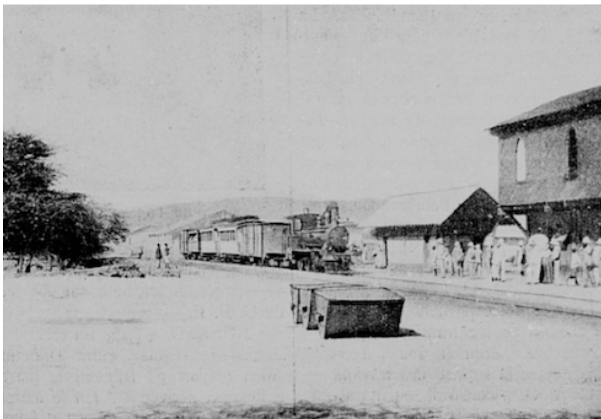
L'arrivée du train en gare de Djibouti

La Compagnie du Chemin de fer franco-éthiopien de Djibouti à Addis-Abeba a été constituée, dans l'année 1909, à l'effet de reprendre l'exploitation du chemin de fer déjà construit de Djibouti à Diré-Daoua (310 km.) et de construire et d'exploiter le prolongement de ce chemin de fer jusqu'à Addis-Abeba (480 km.). La longueur totale de cette ligne, reliant le port français de Djibouti (Côte des Somalis) à la capitale de l'Empire d'Éthiopie, sera donc de 790 km.