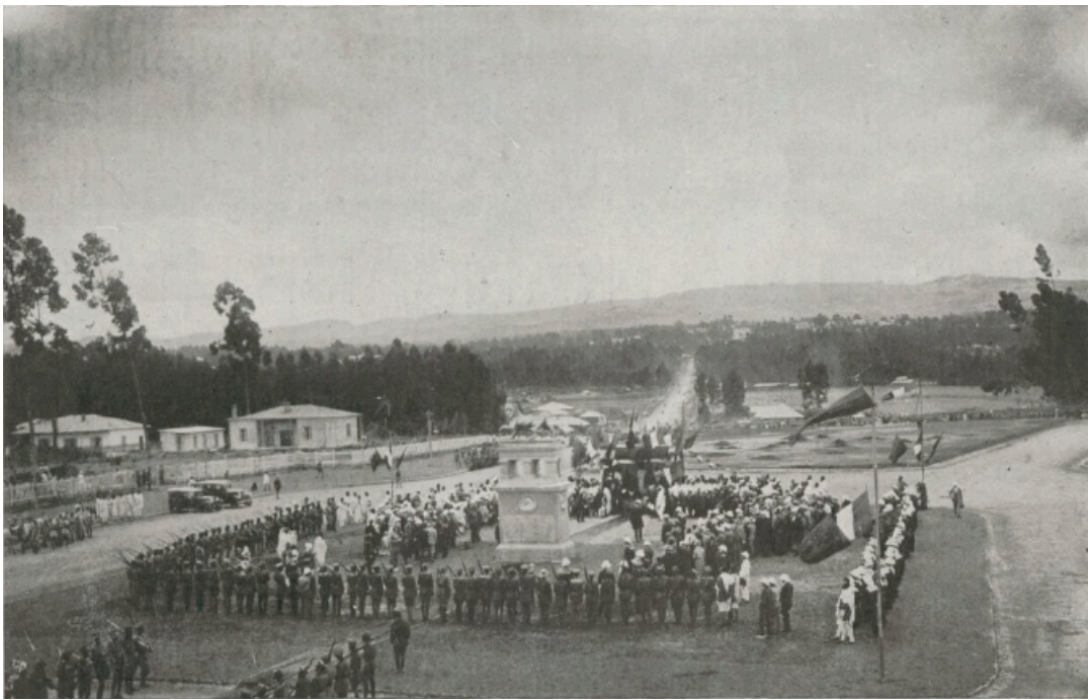
Addis-Abéba : inauguration du monument à l'empereur Ménélick devant la gare.