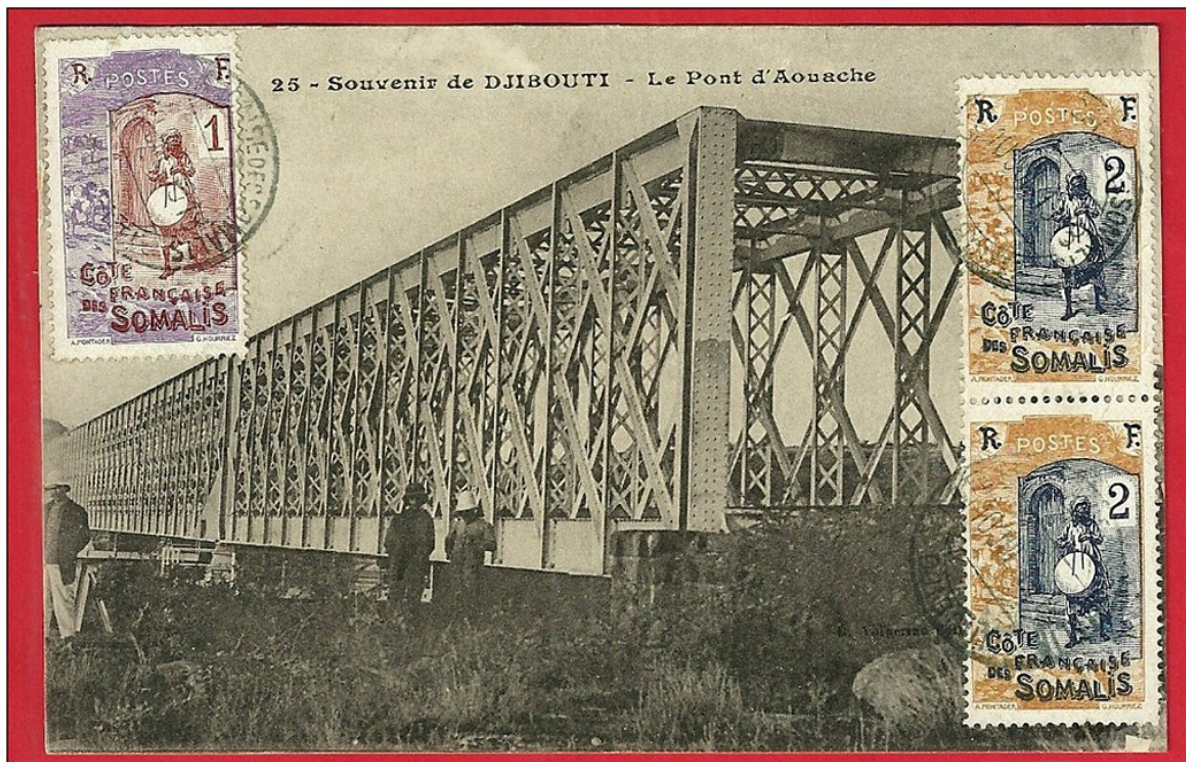
Pont sur l'Aouache

Réunis le 26 juin en assemblée générale, les les actionnaires de cette société ont approuvé les comptes de 1912. Les recettes brutes de l'exploitation se sont élevées à 2.261.083 fr., contre 2.724.849 fr. en 1911. Avec les « produits divers », le total atteint 2.278.000 fr. Les dépenses d'exploitation ont été de 1.071.044 fr. contre 1.128.758 fr. : l'annuité payée à la « Compagnie impériale » a exigé 610.749 fr. : il a été versé à la réserve d'exploitation 77.112 francs, ce qui a été réparti comme suit : sous réserve de l'approbation du ministre des Colonies : réserve statutaire, 38.801 fr. : remboursé à l'État, 96.050 fr. ; provision de gestion, 384.305 fr. L'an dernier, la Compagnie avait dû demander à l'État une avance de 133.698 fr.