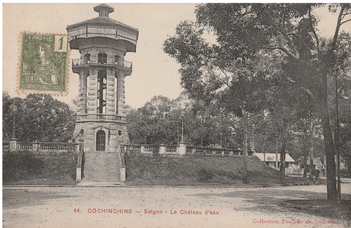
Saïgon. — Le château d'eau.