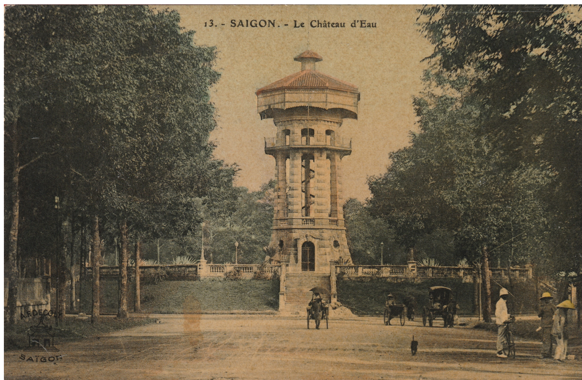
www.entreprises-coloniales.fr/empire/Coll._Olivier_Galand.pdf Saigon. — Le château d'eau.