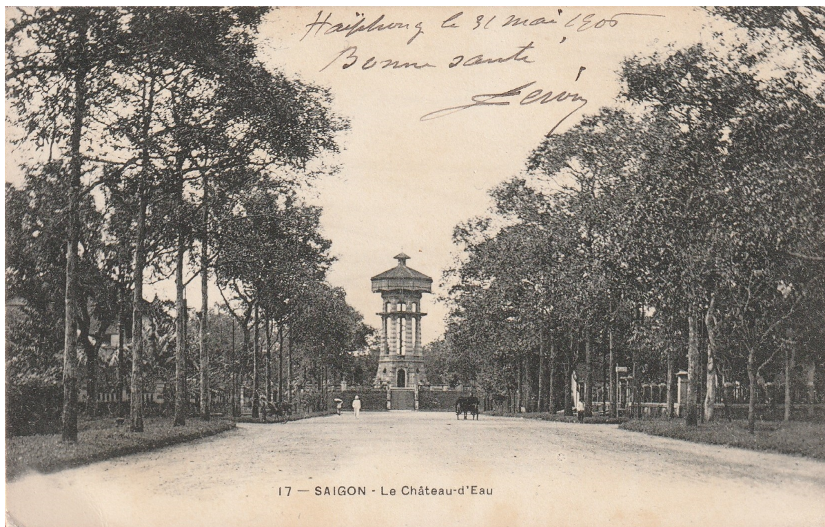
Saïgon. — Le château d'eau (1905).