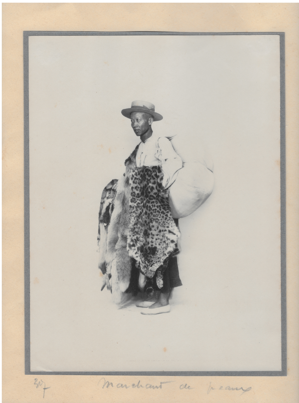
Marchand de peaux