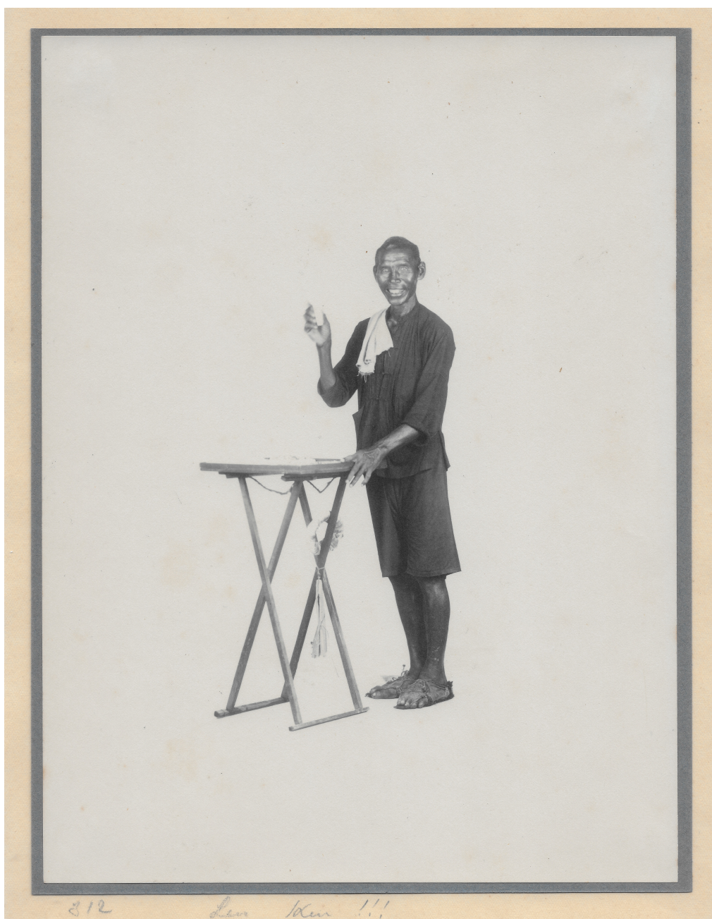
« Len Ken !!! » (onomatopée évoquant probablement le bruit des ciseaux) Barbier